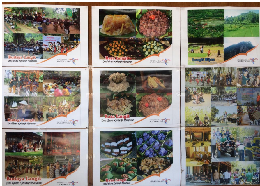
Gambar 1. Potensi Desa Wisata Kaki Langit

Ketersediaan destinasi wisata yang ada di Desa Wisata Kaki Langit bermacam-macam dapat dilihat dari potensi yang ada seperti keindahan alam berupa perbukitan yang masih asri sehingga muncul destinasi seperti kebun buah Mangunan dan hutan pinus. Untuk tradisi dan budaya di Desa Kaki Langit sudah ada sejak lama sebelum adanya desa wisata yang memang sudah menjadi kebiasaan masyarakat Padukuhan Mangunan seperti gejug lesung yang dahulu untuk menandakan saat musim panen padi telah tiba sekarang sebagai tradisi penyambutan wisatawan, selain itu budaya yang ada di Desa Wisata Kaki Langit salah satunya yang menjadi ciri khas yakni konsep homestay dengan menggunakan ciri khas bangunan jawa limasan dan joglo.