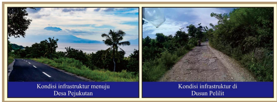
Gambar 3. Kondisi Infrastruktur Menuju Desa Pejukutan dan di Dusun Pelilit