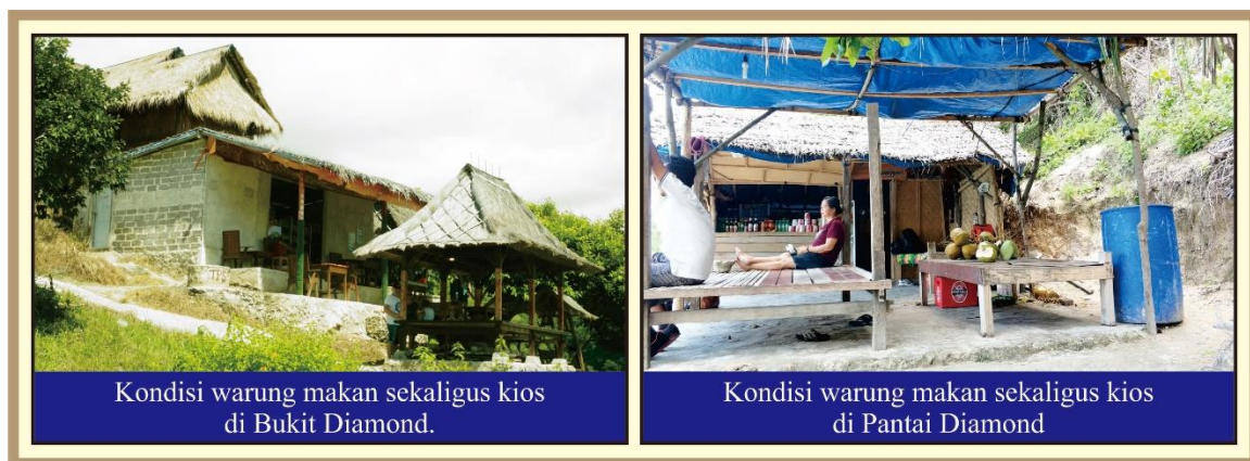
Gambar 4. Fasilitas Warung Makan dan Kios di DTW Pantai Diamond

Masyarakat sebagai responden penelitian didominasi oleh masyarakat yang berasal dari Desa Pejukutan dan bekerja sebagai SDM Pariwisata di Dusun Pelilit, berjenis kelamin pria dengan rentang usia antara 35 – 49 tahun.