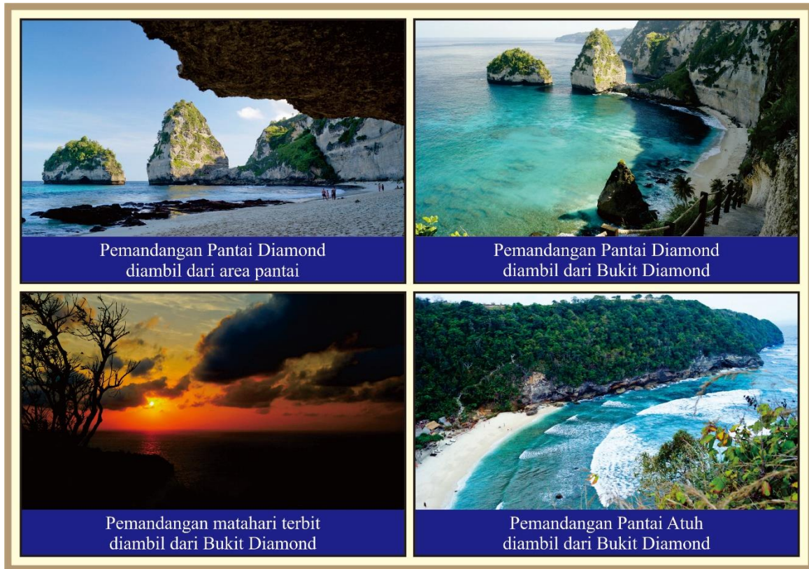
Gambar 2. Kualitas Pemandangan Alam DTW Pantai Diamond