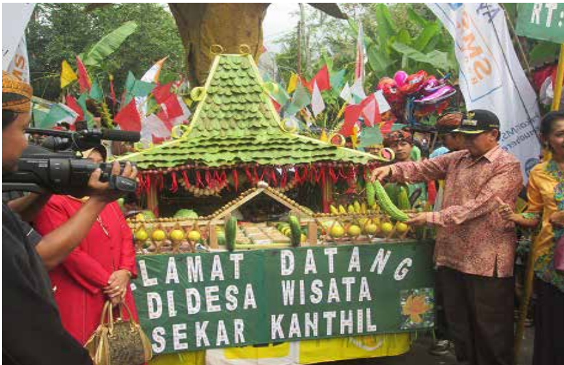
Foto 2: Festival Jolen sebagai Daya Tarik Wisata di Desa Kemetul

Desa Kemetul adalah salah satu dari 208 desa di Kabupaten Semarang yang dipromosikan menjadi desa wisata. Desa Kemetul mulai dikembangkan menjadi desa wisata pada bulan Juni 2011. Menurut Pemerintah Kabupaten Semarang dengan adanya program desa wisata maka desa-desa yang masih kurang dalam hal perekonomian dapat terangkat. Desa Kemetul masih dikategorikan sebagai desa embrio sehingga masih perlu pendampingan dari Dinas Pariwisata. Desa Kemetul di bawah pendampingan Dinas Pariwisata kemudian membuat Kelompok Sadar Wisata (POKDARWIS) yang diberi nama Sekar Kanthil. Tujuan dari POKDARWIS ini adalah untuk menyadarkan masyarakat akan pentingnya partisipasi masyarakat dalam membangun desa wisata.