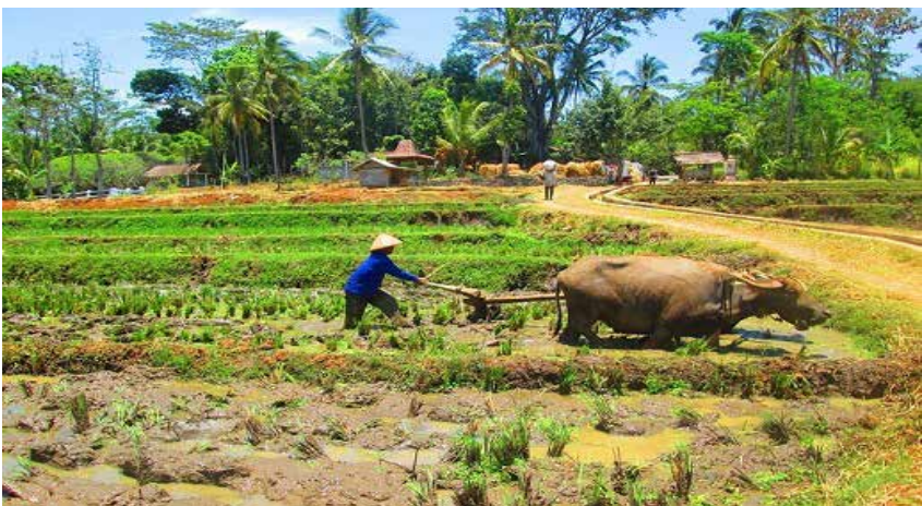
Foto 1: Membajak Sawah Salah Satu Aktivitas Di Desa Kemetul

Desa Kemetul terletak di Kecamatan Susukan Kabupaten Semarang, Jawa Tengah. Luas wilayah Desa Kemetul adalah 166, 5 hektar yang terbagi menjadi empat dusun, yaitu Kaliwarak, Kiduljurang, Krajan, dan Sipenggung. Menurut data kependudukan 2016, jumlah penduduk di Desa Kemetul adalah 1714 jiwa, yang terdiri dari 847 laki-laki dan 867 perempuan. Penduduk Desa Kemetul mempunyai tingkat pendidikan yang variatif, lulusan SD (473 orang), SMP (353), SMA (197 orang), Perguruan Tinggi (15 orang), dan sisanya tidak bersekolah. Mata pencaharian penduduk Desa Kemetul didominasi oleh petani dan buruh, sedangkan penduduk lainnya bekerja sebagai PNS, pengusaha, dan pegawai swasta.