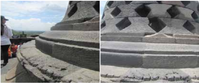
Gambar 1 Keausan pada Relief Dekoratis Stupa Teras yang Berisikan Arca Kunto Bimo Sumber : Dok. Pribadi 2016

terjadinya kerusakan pada struktur candi, yaitu faktor dari dalam (biasanya disebabkan oleh keroposnya bangunan itu sendiri) dan faktor dari luar (dikarenakan oleh alam biotik dan abiotik serta aktivitas manusia baik yang disengaja maupun tidak disengaja). Beberapa jenis kerusakan yang disebabkan oleh manusia akibat pemanfaatan struktur Candi Borobudur untuk kegiatan pariwisata antara lain : 1) keausan yang terjadi pada lantai, tangga candi maupun pinggiran stupa teras akibat gesekan antara batu penyusun candi dengan butiran pasir yang dibawa wisatawan melalui alas kaki, 2) vandalisme berupa coretan batu dan patahnya bagian relief akibat dipegang wisatawan, dan 3) pergeseran batu penyusun candi (hasil wawancara salah seorang arkeolog di Balai Konservasi Borobudur pada tanggal 28 Januari 2016).