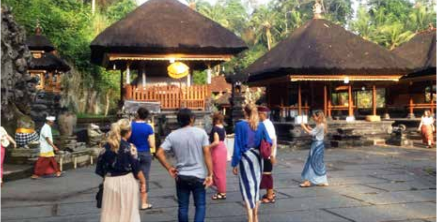
Foto 2. Wisatawan asing di Ancient Track One.

kegiatan keseharian alamiah mereka, dengan adanya kegiatan pariwisata ancient track one diharapkan terciptanya pekerjaan tambahan masyarakat sehingga diharapkan pendapatan masyarakat lokal dapat meningkat dan berikut dapat dilihat pada Foto 2.