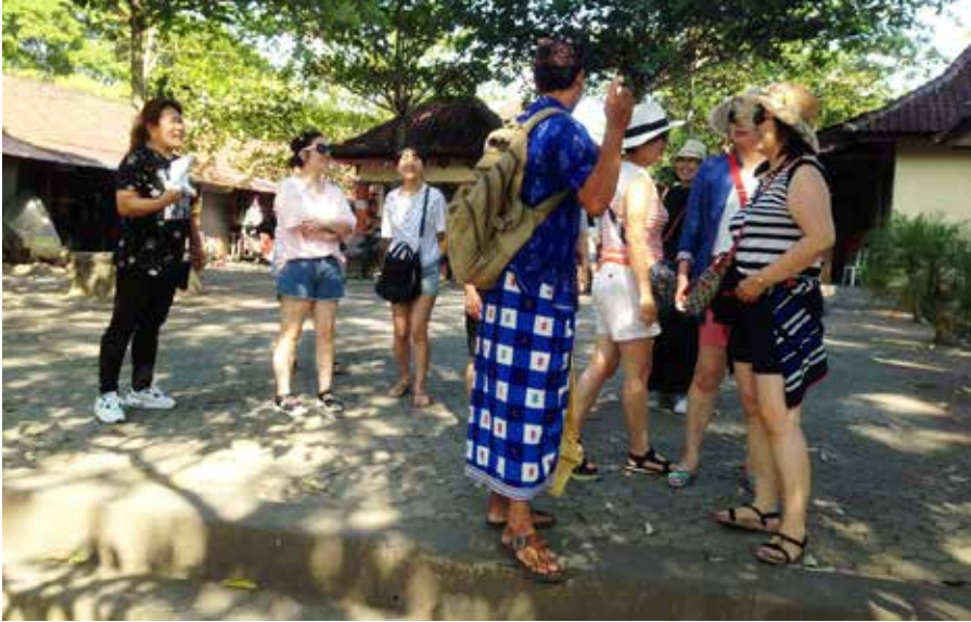
Foto 3. Wisatawan Ancient Track One di Goa Gajah.