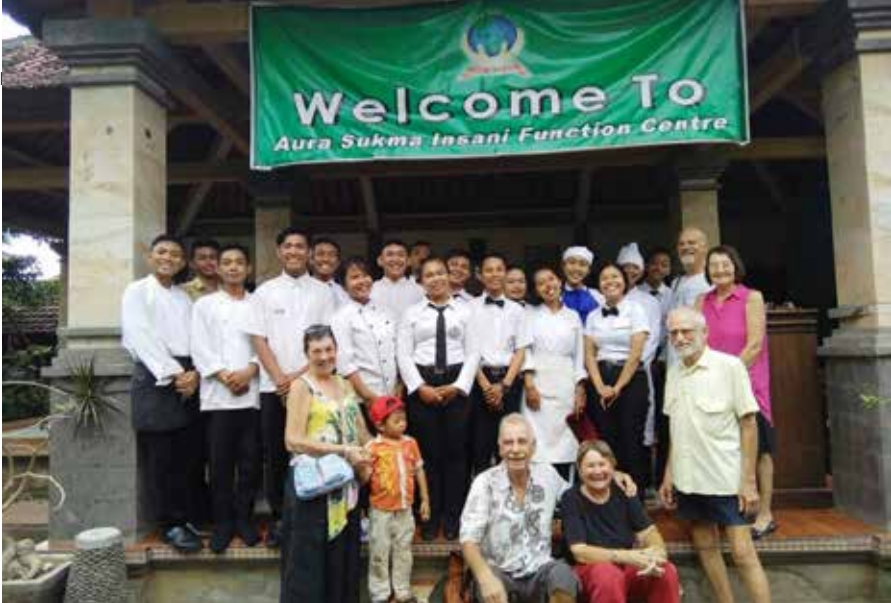
Foto 2. Setelah menyelesaikan pelatihan simulasi restaurant, kitchen dan front office para peserta pelatihan dan para tamu berkumpul untuk berfoto bersama.

relevan, pengaturan manajemen, pemasaran, pengawasan, penggunaan sistem pelaksanaan pendidikan yang jelas, sistem perekrutan calon peserta pelatihan, kerja sama dengan pihak pemakai lulusan, dan memberikan professional development yang berkelanjutan; manfaat Tourism and Home Assistant Program terhadap kegiatan wisata di Kabupaten Buleleng adalah promosi pariwisata Kabupaten Buleleng melalui kegiatan kepedulian sosial.