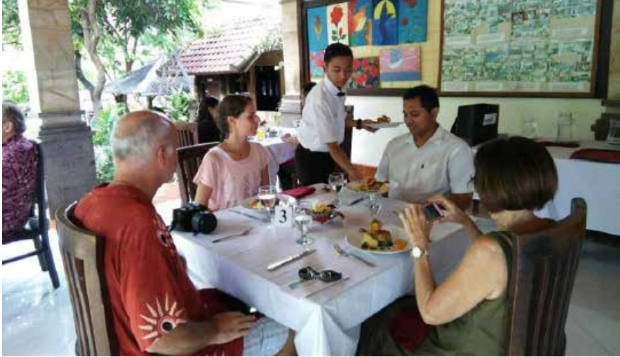
Foto 1. Salah satu praktik dalam kegiatan simulasi pelatihan di bidang tata hidang atau food and beverage service .

kompetensi. Dengan kata lain, pemberdayaan secara akademik yang memberi bekal kepada peserta pelatihan untuk bisa mendapatkan pekerjaan di industri.