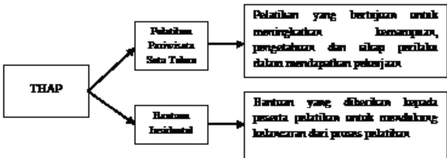
Gambar 1. Bentuk Pemberdayaan Pelatihan Tourism and Home Assistant Program

Program ini merupakan bentuk pemberdayaan karena dengan pelatihan pariwisata satu tahun mampu mengubah peserta pelatihan dari kurang paham menjadi paham, dari kurang mampu menjadi mampu dan memiliki