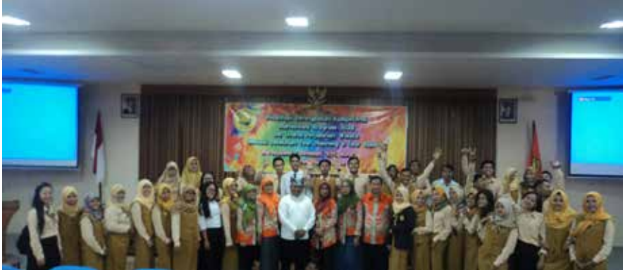
Foto 1. Mahasiswa berfoto bersama sebelum melakukan pelatihan perencanaan tur dan pemandu wisata.

Matrik internal factor analisis summary (IFAS) dan matrik eksternal factor analisis summary (EFAS) digunakan untuk mengetahui kekuatan, kelemahan, peluang dan ancaman, selanjutnya analisis SWOT ( Strength, Weaknesses, Opportunitites, Threat ) untuk menghasilkan strategi alternatif dan analisis QSPM ( Quantitative Strategies Planning Matrix ) untuk menghasilkan strategi prioritas.