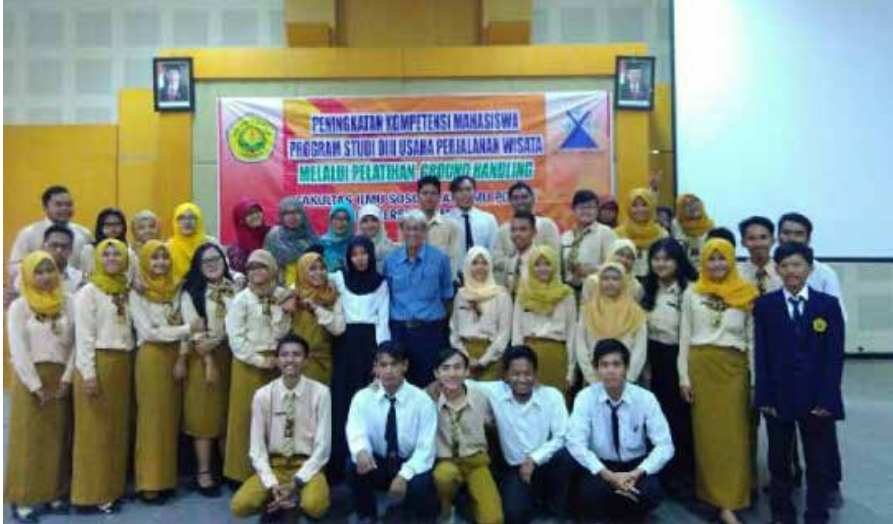
Foto 3. Mahasiswa mengikuti pelatihan ground handling .