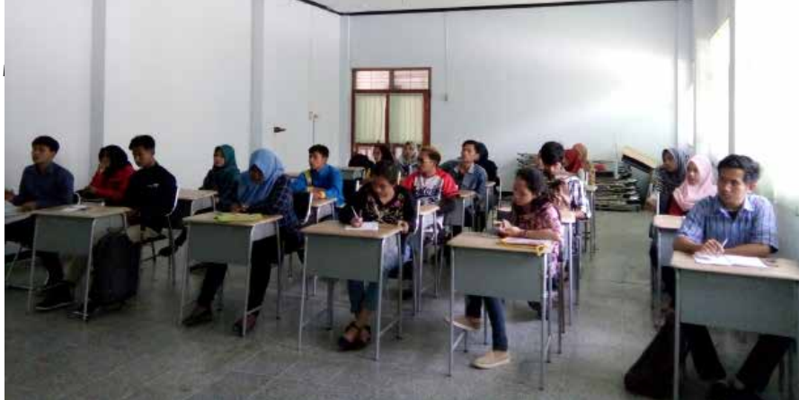
Foto 2. Mahasiswa mengikuti perkuliahan.