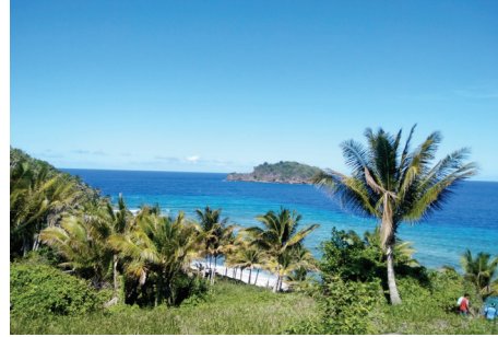
Lokasi Penelitian, Kawasan Nusa Tabukan, Kab. Kepulauan Sangihe.

Data yang diperoleh dianalisis menggunakan teknik analisis deskriptif kualitatif dan SWOT ( Strengths, Weaknesses, Opportunities, Threats ) untuk memperoleh gambaran secara lengkap, sebagai dasar dari perumusan strategi pengembangan.