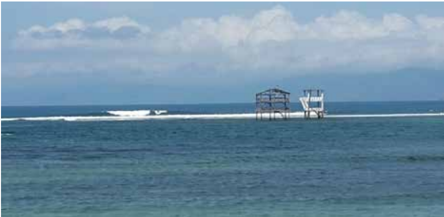
Gambar 3.1 Gelombang Periscope.