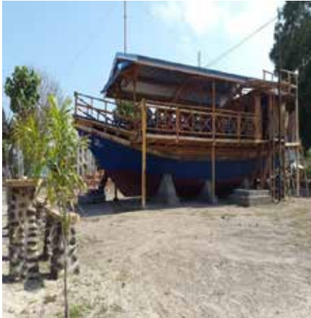
Gambar 3.8 Akomodasi hotel di destinasi pariwisata Lakey-Hu'u.