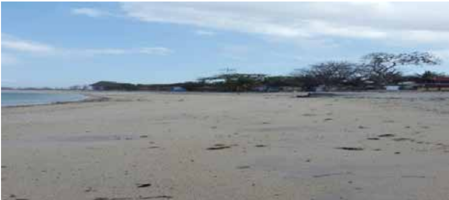
Gambar 3.3 Gelombang Lakey Pipe.