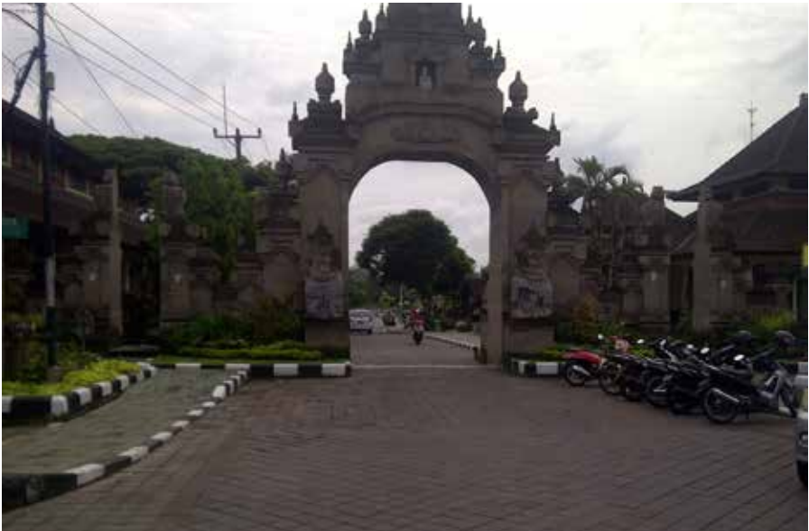
Foto 2. Pembangunan Candi Kurung sebagai salah satu upaya penataan kawasan Pura Taman Ayun.

pembenahan pasca ditetapkan sebagai Warisan Budaya Dunia. Dengan bantuan dari pihak pemerintah, perbaikan fasilitas diantaranya adalah perbaikan bangunan wantilan , candi bentar , toilet , dan lain-lain. Puri Mengwi juga menambah papan informasi di jalur-jalur yang dilalui oleh wisatawan. Papan informasi tersebut dapat berupa petunjuk jalan, anjuran maupun larangan.