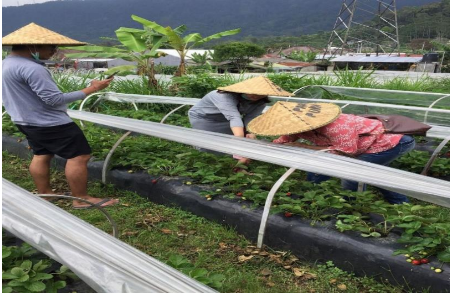
Gambar 3. Petani Stroberi di Desa Pancasari

Pengembangan desa wisata yang berkelanjutan di Desa Pancasari mengutamakan keseimbangan ekonomi, lingkungan, dan aspek sosial budaya. Melalui partisipasi masyarakat, pengembangan pariwisata dengan memanfaatkan lahan pertanian sebagai wisata aktivitas pertanian dapat meningkatkan ekonomi masyarakat. Keunikan sosial budaya masyarakat Desa Pancasari juga menjadi daya tarik bagi wisatawan untuk berpartisipasi dalam kegiatan pertanian dan perkebunan. Pengembangan destinasi pariwisata harus mempertimbangkan lingkungan dan mengoptimalkan potensi tanpa merusaknya. Desa Pancasari memiliki luas lahan pertanian yang dikelola oleh kelompok tani, dan wisatawan dapat melihat langsung aktivitas pertanian serta mengikuti kelas pertanian. Keberadaan kelompok tani sertifikat seperti Kelompok Tani Segening dan Bali Buyan Berry memberikan manfaat bagi masyarakat dan memberikan kesempatan bagi mahasiswa bidang pertanian untuk berpraktek lapangan dan pertukaran ilmu.