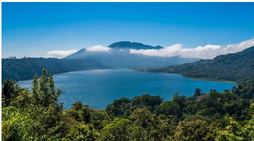
Gambar 2. Danau Buyan di Desa Pancasari

Desa Pancasari terkenal karena keindahan alamnya dan potensi wisatanya. Desa ini memiliki pemandangan danau Buyan, bukit dan gunung yang indah, serta hutan hijau yang menarik. Wisatawan dapat menikmati danau dengan bersantai di tepi danau, menjelajahi sekitarnya dengan perahu, atau mengikuti kegiatan outbound. Desa Pancasari juga mengembangkan konsep desa wisata, di mana masyarakatnya berperan dalam pengembangan pariwisata. Model community based tourism digunakan untuk memberdayakan masyarakat dan meningkatkan perekonomian mereka. Diharapkan, potensi wisata alam yang dikelola oleh masyarakat dapat memberikan dampak positif tidak hanya pada perekonomian, tetapi juga dalam meningkatkan pengetahuan dan pengalaman berwirausaha serta mengurangi ketergantungan pada pekerjaan utama sebagai sumber penghasilan.