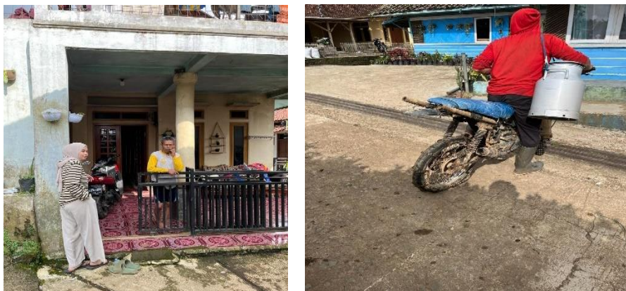
Gambar 6. Live-in Pasir Angling