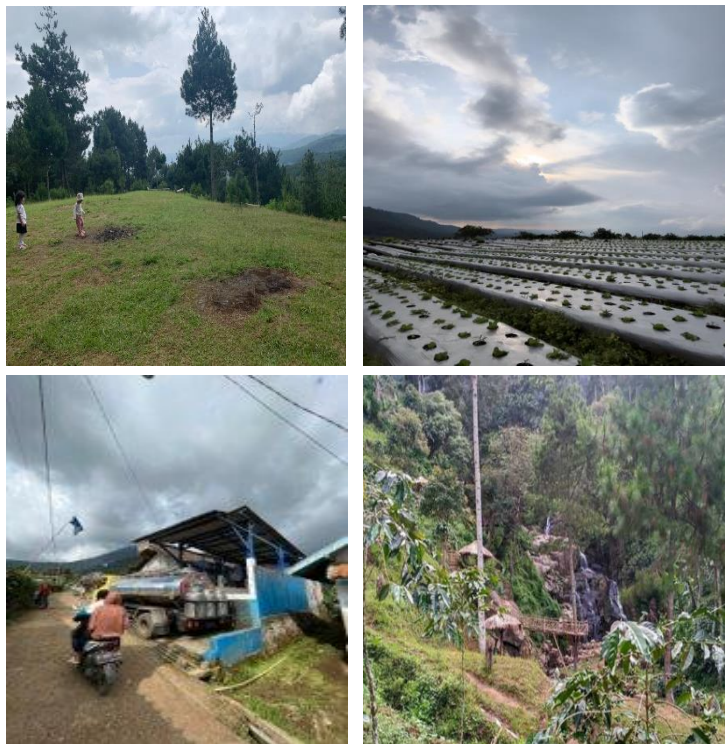
Gambar 1. Kondisi lokasi dan masyarakat Kampung Pasir Angling