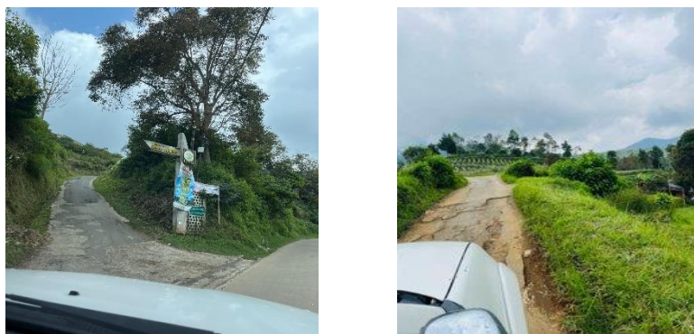
Gambar 2. Jalan Masuk dan kondisi jalan menuju lokasi

Potensi-potensi tersebut tampaknya harus ditempuh dengan menhadapi konsekuensi lain. Perjalanan ke kampung tersebut membutuhkan waktu sekitar 2 jam perjalanan dengan trek mendaki dari Kota Bandung. Terlebih lagi, dalam perjalanan akan bertemu banyak objek wisata lain. Seringkali kemacetan panjang terjadi di sekitar objek-objek tersebut.