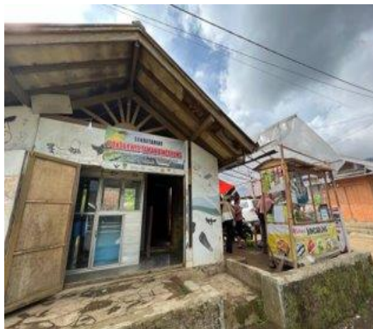
Gambar 4. Kantor Sekretariat Kelompok Sadar Wisata

Keberadaan kantor kesekretariatanpun sudah terpenuhi dengan status sewa bangunan. terlihat kantor tersebut juga diiringi dengan dagangan lainnya seperti air minum dan makanan. Menurut sekretaris pokdarwis tersebut, penyewaan ini dilakukan atas nama pribadi sehingga bentuk dagangan itu adalah bagian dari usahanya dan tidak ada berkaitan dengan pokdarwis.