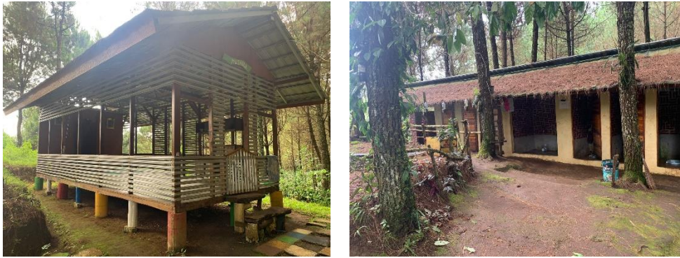
Gambar 5. Fasilitas Rumah Ibadah dan toilet umum yang dibangun Mapala