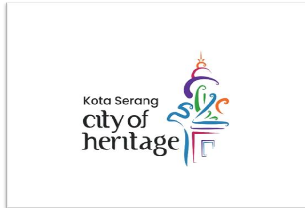
Gambar 3. Logo dan Tagline Pariwisata Kota Serang