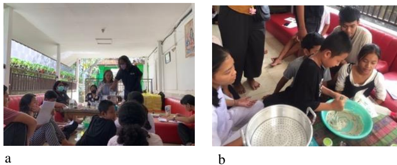
Gambar 3.2. Demostrasi dan praktek pembuatan lulur. (a) Demostrasi pembuatan lulur serbuk dan krim yang mengandung serbuk lamun. (b) Praktik pembuatan lulur krim

Produk yang dihasilkan ditampilkan pada Gambar 3.3. Semua alat-alat yang digunakan dalam pembuatan lulur dan krim disumbangkan ke Panti Asuhan Sunya Giri (Gambar 3.3c).