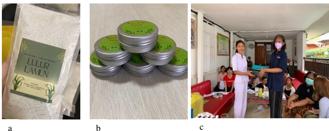
Gambar 3.3. Produk yang dihasilkan dan sumbangan alat ke Panti Asuhan Sunya Giri. (a) Lulur serbuk yang mengandung serbuk lamun. (b) Lulur krim yang mengandung serbuk lamun (c) Serah terima alat untuk Panti Asuhan Sunya Giri

Produk yang dihasilkan ditampilkan pada Gambar 3.3. Semua alat-alat yang digunakan dalam pembuatan lulur dan krim disumbangkan ke Panti Asuhan Sunya Giri (Gambar 3.3c).