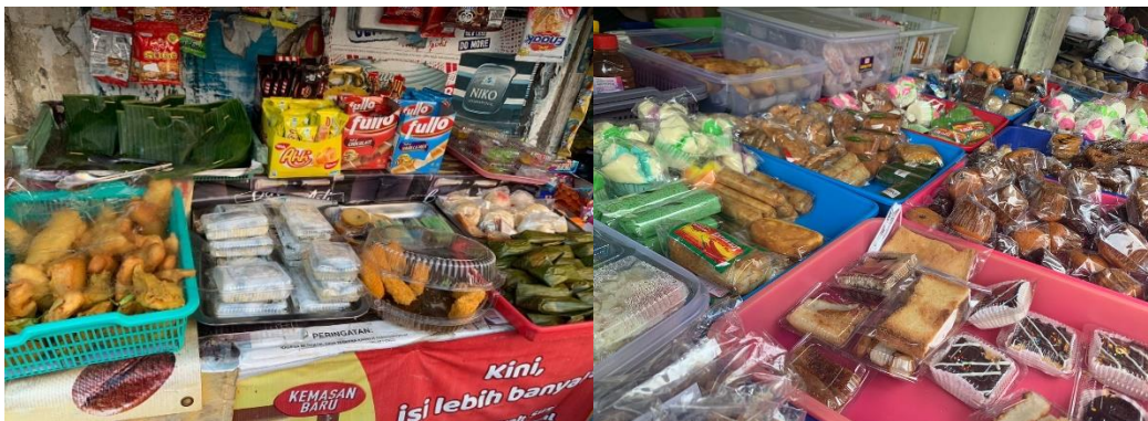
Gambar 3.2 Perbaikan pengemasan produk