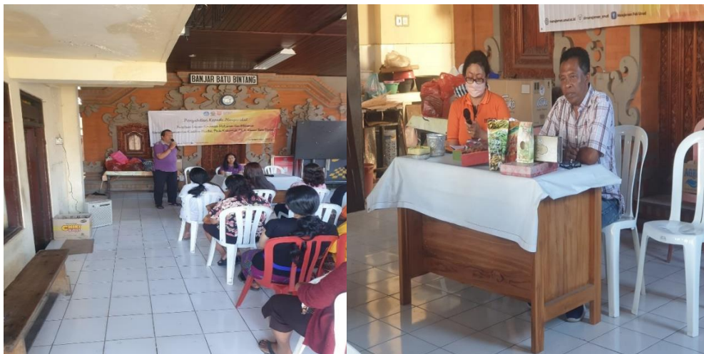
Gambar 3.3 Pelaksanaan kegiatan pengabdian