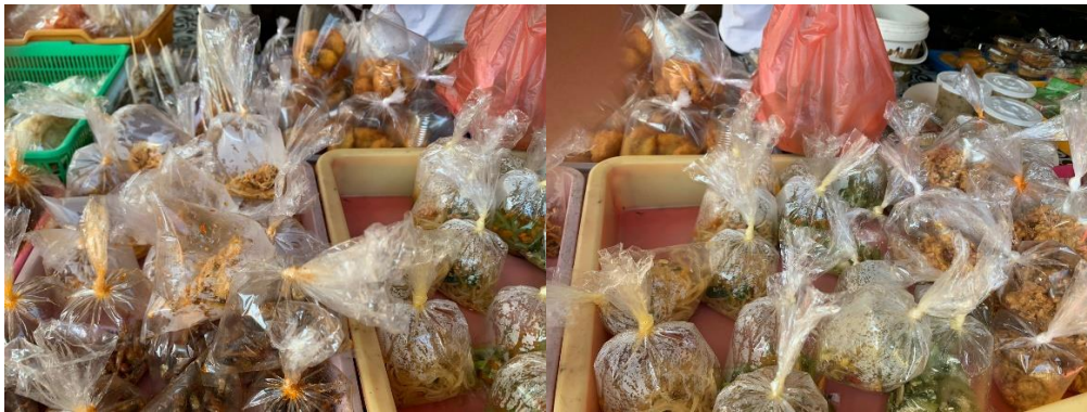
Gambar 3.1 Kemasan produk sebelum kegiatan