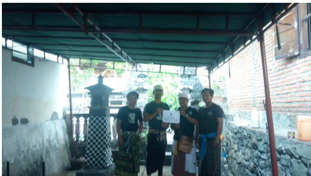
Gambar 3.3. Penyerahan tetaring Bale Gong

Setelah selesai dilakukan pemasangan tetaring Bale Gong yang dilakukan secara bersama-sama serta Krama Pura Sindetan sudah mengerti dan memahami cara memasang dan membongkar tetaring tersebut maka langkah berikutnya adalah penyerahan tetaring Bale Gong kepada Kelian dan Krama Pura Sindetan. Kegiatan ini dapat dilihat pada Gambar 3.3.