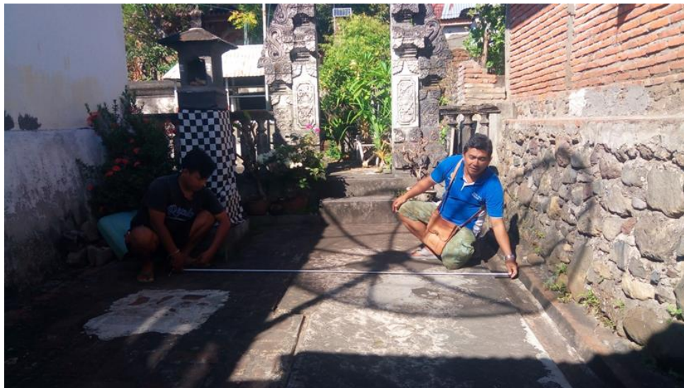
Gambar 3.1. Rancangan tetaring untuk Bale Gong