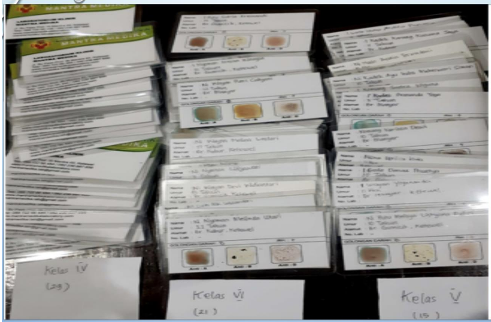
Gambar 3.2. Kartu Golongan Darah ABO-Rhesus Siswa SDN 3 Ketewel

Hasil pengujian penggolongan darah ABO-Rh dari 65 orang siswa terdiri dari 30 (46%) orang siswa wanita dan 35 (54%) orang siswa laki-laki. Hasil pemeriksaan Rhesus (Rh) menunjukkan seluruh siswa yang diperiksa 65 orang (100%) menunjukkan hasil Rh+. Distribusi golongan darah ABO pada siswa laki-laki sebanyak 5 orang (14%) golongan darah A; 9 orang (25%) dengan golongan B; 22 orang (62%) memiliki golongan O dan hanya 1 siswa (3%) golongan darah AB. Sedangkan distribusi golongan darah ABO pada siswa wanita adalah sebanyak 4 orang (13%) memiliki golongan darah A; 10 orang (33%) golongan B dan 14 orang (47%) golongan darah O. Seperti ditunjukkan pada Gambar 3.3.