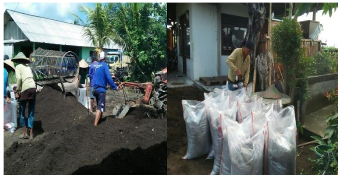
Gambar 3.4 Pengemasan Pupuk