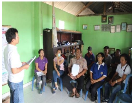
Gambar3.3 Pelatihan Software