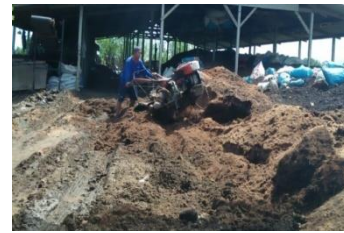
Gambar 3.2. Pencampuran bahan baku pupuk