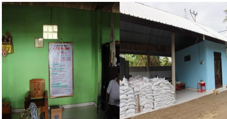
Gambar 3.5. Kantor baru dan Struktur organisasi serta Gudang Baru