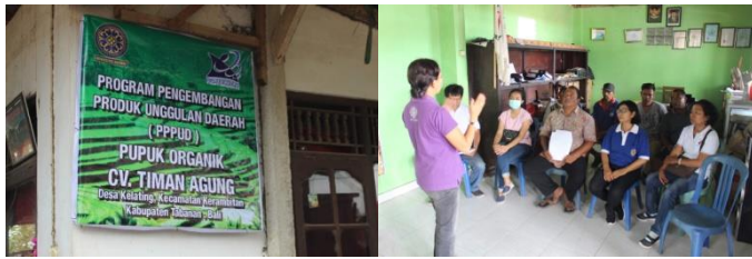
Gambar 3.1 Penyuluhan Manajemen Produk di CV Timan Agung, Klating Tabanan

Pelaksanaan kegiatan pengabdian ini dapat dilihat pada Gambar 3.1-3.6