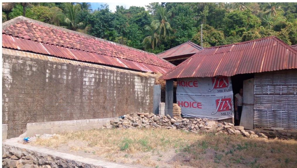
Gambar 6. Letak Lokasi WC Umum Dari Jauh