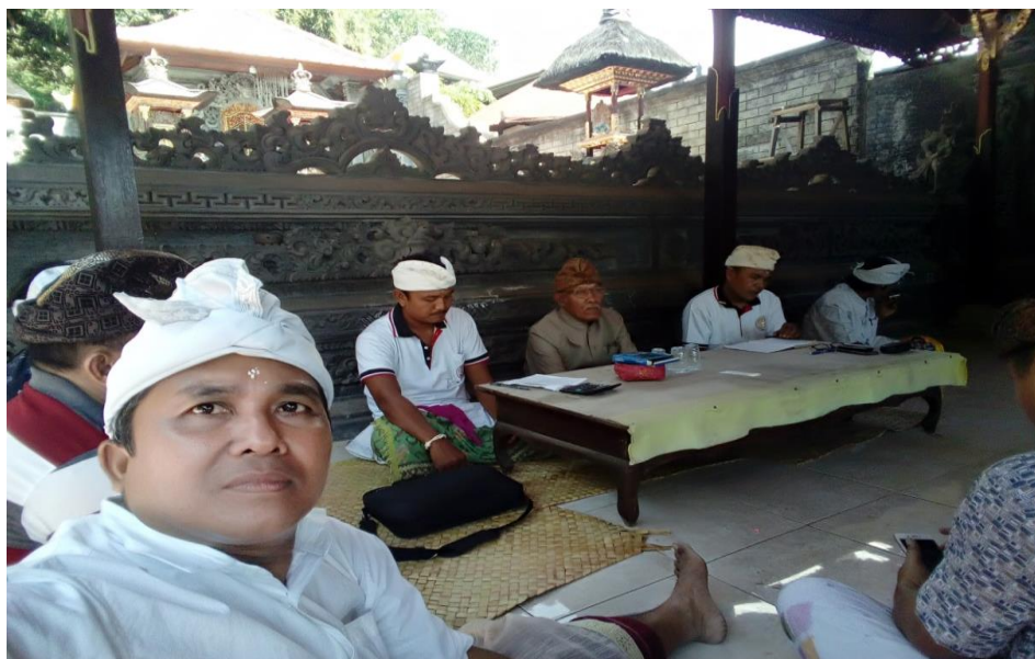
Gambar 3. Tim Pengabdian Pada Pertemuan