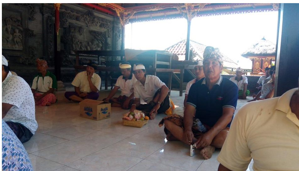
Gambar 4. Krama Pura DadiaTutuan

Pada pertemuan tersebut selain membahas dan memutuskan letak lokasi WC umum, kami Tim Pengabdian menyampaikan tentang adanya bantuan biaya untuk pembangunan WC umum tersebut dari Universitas Udayana melalui Program Udayana Mengabdi.