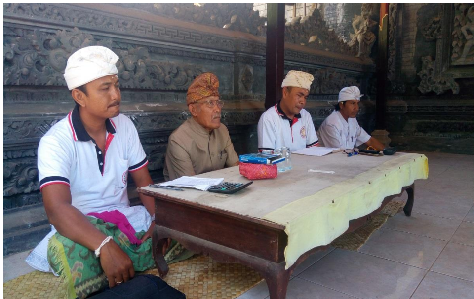
Gambar 2. Prajuru Pura Dadia Tutuan

Pembangunan WC umum yang akan dilakukan di Pura Dadia harus memperhatikan kesucian dan keindahan pura. Untuk itu perlu ditentukan letak lokasi WC umum yang akan dibuat. Sehingga Prajuru dan Krama Pura Dadia Tutuan melaksanakan pertemuan untuk membahas dan memutuskan letak lokasi WC umum tersebut yang dilaksanakan pada Rabu, 24 Juli 2019 bertepatan dengan Hari Raya Galungan yang dapat dilihat pada Gambar 2, Gambar 3, dan Gambar 4.