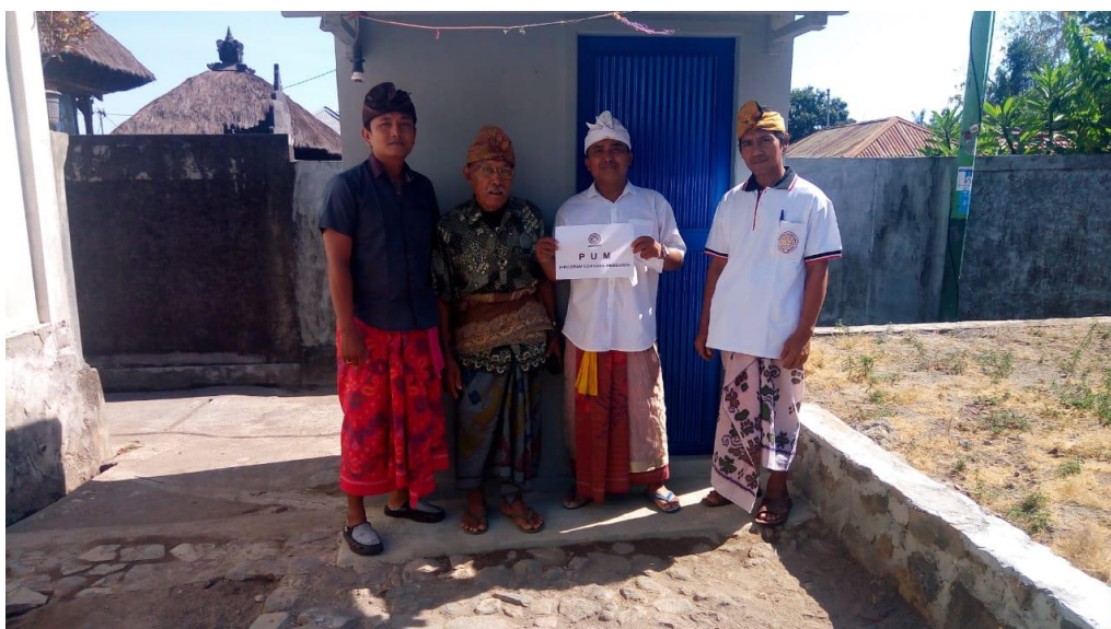
Gambar 8. Penyerahan Bangunan WC Umum

Bangunan WC Umum yang sudah melalui proses dan dilakukan pengawasan dalam mengerjakannya pada akhirnya dapat diselesaikan. Sehingga langkah selanjutnya dilakukan penyerahan Bangunan WC Umum tersebut kepada Krama Pura Dadia Tutuan melalui Prajuru Pura Dadia Tutuan. Penyerahan Bangunan WC Umum tersebut dihadiri oleh Kelihan, Wakil, Sekretaris, Bendahara, dan beberapa karma Dadia Tutuan. Pada saat penyerahan Bangunan WC Umum tersebut dihadiri juga oleh Tim Pengabdian. Penyerahan Bangunan WC Umum tersebut dapat dilihat pada Gambar 8.