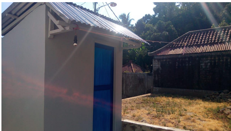
Gambar 7. Bangunan WC Umum