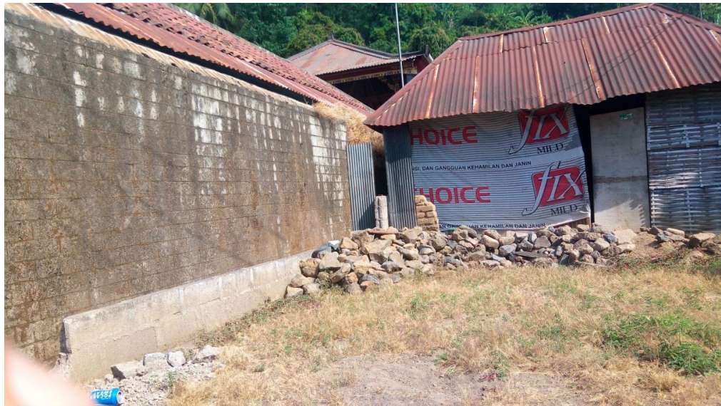
Gambar 5. Letak Lokasi WC Umum Dari Dekat