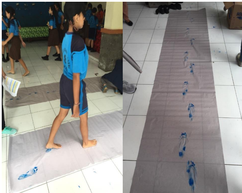
Gambar 3.4 Pemeriksaan gait parameter di SDN 8 Dauh Puri