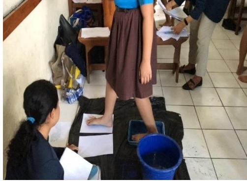
Gambar 3.3 Pemeriksaan tipe arkus pedis di SDN 8 Dauh Puri