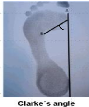
Gambar 3.1 Penilaian pedis dengan Clarke's angle (Pita-Fernández et al. , 2015)

Pengukuran tipe arkus pedis dengan melakukan footprint, footprint test dengan cara kedua kaki subjek menapak matras spons yang telah berisikan tinta lalu menapakkan kedua kakinya pada kertas polos sehingga akan terlihat sidik pedis subjek. Pengukuran tipe arkus selanjutnya diperiksa dengan Clarke's angle .