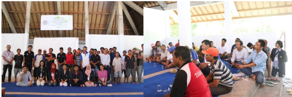
Gambar 2. Pelaksanaan kegiatan penyuluhan.

Pemindangan adalah salah satu cara pengolahan ikan segar dengan kombinasi perlakuan antara penggaraman dan perebusan. Garam yang digunakan berperan sebagai pengawet sekaligus memberikan cita rasa pada ikan sedangkan perebusan bertujuan untuk mematikan sebagian besar bakteri pada ikan terutama bakteri pembusuk (Adawyah, 2007). Jenis ikan yang digunakan yaitu ikan layang. Ikan Layang merupakan ikan pelagis, berkadar garam tinggi, dan membentuk gerombolan besar. Panjang tubuh umumnya 20 – 30 cm, bentuk badan panjang dan agak gepeng, warna punggungnya biru tua, dan perut berwarna putih (Ditjen Perikanan, 1979).