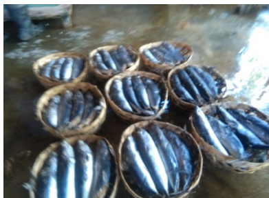
Gambar 3. Ikan pindang hasil produksi masyarakat desa Bondalem yang dipasarkan di luar desa.