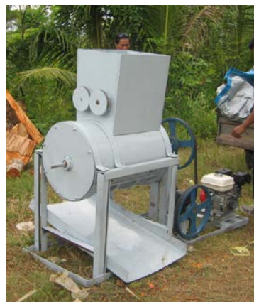
Gambar 4 Mesin saringan luluh bahan baku bata asab

Hasil perancangan alat penyaring luluh tanah liat bahan baku bata asab (bata merah gosok) dapat dilihat pada Gambar 4.