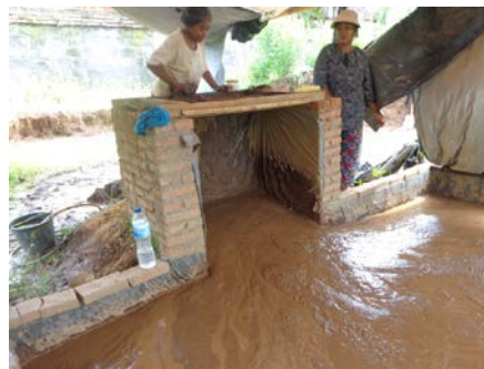
Gambar 2. Proses penyaringan luluh tanah merah bahan bata asab

Salah satu permasalahan utama dalam pembuatan bata asab yaitu pada proses penyaringan luluh tanah merah, dimana prosesnya masih dikerjakan dengan cara konvensional (gambar 2), sehingga kuantitas atau jumlah produk yang dihasilkan sangat rendah dan dalam waktu yang cukup lama. Dalam satu hari (8 jam kerja) hanya mampu menghasilkan sekitar 1 m 3 luluh halus bahan baku bata asab.