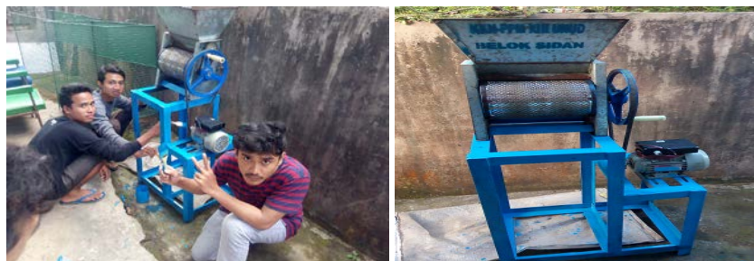
Gambar 8. Mesin Pemecah Kopi

Pembuatan mesin pemecah kopi basah ini atas hasil survey dan permohonan kelompok kerja koperasi untuk dilakukan modifikasi terhadap mesin pemecah kopi yang ada. Permasalahan mesin yang ada yaitu hasil pemecah yang tidak maksimal, sebagian besar kopi menjadi hancur hal ini disebabkan oleh putran yang sangat tinggi. Maka kelompok KKN-PPM UNUD merancang ulang mesin pemecah kopi. Dengan melakukan penggantian terhadap beberapa komponen seperti motor putaran rendah, system transmisi dll. Hasil dari kegiatan ini desain mesin pemecah kopi dengan putaran 60 rpm. Dari uji coba hasilnya cukup memuaskan. Jumlah kopi yang rusak/hancur sekitar 1 persen.