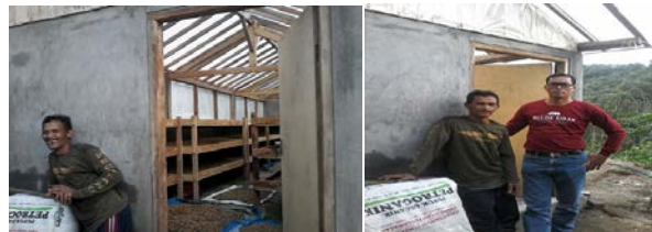
Gambar 7. Pengeringan Kopi Teknologi Rumah Kaca

Ukuran pengeringan metode rumah kaca 5 m lebar dan panjang 10 m. kapasitas pengeringan maksimum 500 kg, dengan system tumpak terdiri dari 3 tingkat. Temperatur maksimum ruangan pengering yang dapat tercapai 50 derajat celcius. Dari uji coba lama pengeringan mencapai 3 hari.