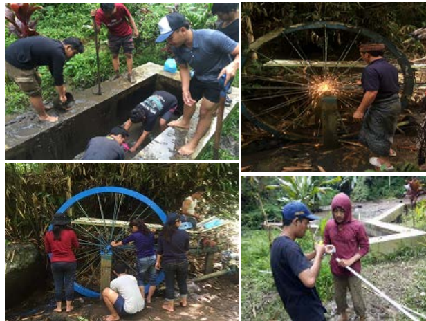
Gambar 1. Kegiatan Pompa Kincir

Hasil yang telah dicapai pada kegiatan ini, telah terwujudnya sistem air bersih melalui penerapan teknologi pompa kincir. Dan sstem sudah bekerja dengan baik dan sesuai harapan. Jumlah KK yang dapat dilayani sebanyak 25 KK.