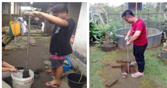
Gambar 11. Pembuatan/Peremajaan Biopori

Hasil kegiatan ini yaitu 100 biopori yang sudah ada diremajakan kembali, dan 50 biopori baru sebagai tambahannya. Biopori ini berfungsi untuk meningkatkan daya resapan air tanah. Semakin banyak air hujan yang bias masuk kedalam tanah maka diharapkan sumber-sumber air akan membesar.