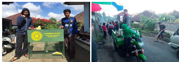
Gambar 4. Kegiatan Kebersihan Lingkungan Dan Penyerahan Keranjang Sampah

Kegiatan kebersihan lingkungan dilaksanakan pada setiap pagi hari dari jam 8.00 sampai 10.00 wita. Mitra yang terlibat dalam kegiatan ini semua anggota PKK dusun Jempanang, semua pemuda dan pemudi serta petugas kebersihan desa Belok Sidan. Pada program ini dari KKN-PPM membuat dan menyumbangkan 5 buah keranjang sampah. Keranjang sampah ini digunakan hanya untuk menampung sampah plastic atau anorganik lainnya. Kegiatan juga diikuti dengan pemasangan poster tentang bahaya sampah plastic.