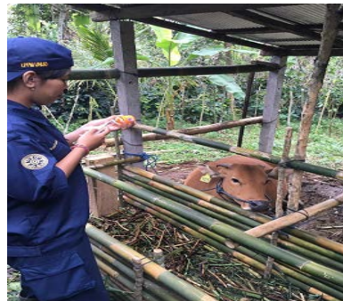
Gambar 6. Pelayanan Kesehatan Ternak

Kegiatan pelayanan kesehatan ternak dilaksanakan oleh mahasiswa dengan target layanan 100 ekor. Pelaksanaan kegiatan langsung pada kandang ternak baik kandang sapi maupun kandang babi. Pada kegiatan ini ternak diberikan vitamin, obat cacing, obat gatal kulit dan vaksin. Untuk peternak diberikan penyuluhan tentang cara beternak yang sehat, seperti kandang yang sehat, cara membuat pakan yang sehat dengan metode silase.