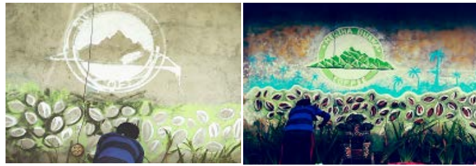
Gambar 9. Pembuatan Logo Keperasi Merta Buana