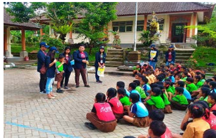
Gambar 5. Kegiatan Penyuluhan Dan Pendampingan Pola Hidup Dan Sehat

Kegiatan PHBS diperuntukan kepada anak Sekolah Dasar 2 Belok/Sidan di dusun Jempanang. Sejumlah 150 orang siswa kelas 1 sampai kelas 6 di berikan penyuluhan dan pelatihan tentang bagaimana cuci tangan yang bersih, bagaimana sikat gigi yang benar, bagaimana membawa tas yang baik. Pada kegiatan ini juga dibagikan perlengkapan sikat gigi dan sabun kepada 150 siswa SD dan anak anak lainnya yang hadir.