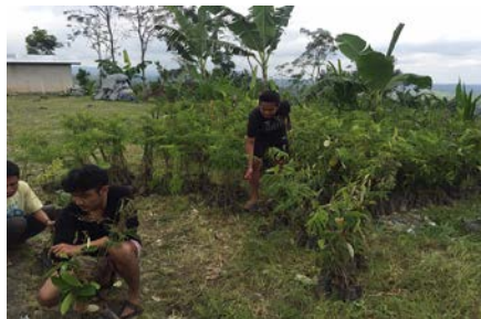
Gambar 10. Penghijauan

Kegiatan penghijauan ini difokuskan di dusun Jempanang pada daerah lereng dan daerah dekan sumber air. Pada program penghijauan ini ditanam dan dibagikan tanaman kepada setiap KK sebanyak 5 pohon duren, 5 pohon nangka, 5 pohon mahoni, 5 pohon mangga. Jumlah KK di dusun Jempanang sebanyak 150 KK. Jadi total tanaman yang didistribusikan ke masyarakat sebanyak 1000 pohon.