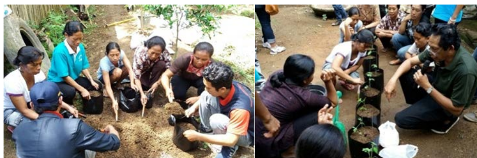
Gambar 3. Anggota MKRPL sedang latihan menyiapkan campuran tanah-kompos-sekam, untuk selanjutnya berlatih menanam bibit hortikultura dalam polibag.

Narasumber penyuluhan sekaligus pelatihan budidaya hortikultura dan pelatihan teknik penyambungan (grafting) berasal dari Fakultas Pertanian Universitas Udayana, menyampaikan teknik penyambungan atau yang lebih dikenal dengan nama grafting dihadapan sekitar 40 orang peserta dari 45 orang yang diundang yaitu kelompok MKRPL dan ibu-ibu rumah tangga lainnya sehingga kehadiran peserta sekitar 88,88%.