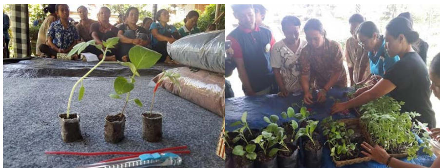
Gambar 4. Hasil grafting tanaman tomat diperkenalkan pada acara pelatihan budidaya hortikultura dan grafting (kiri) dan Anggota MKRPL Desa Getasan sedang berlatih teknik grafting (Kanan)

Potensi desa Getasan dengan 665 KK dengan komoditi utama petani adalah padi sedangkan untuk hortikultura masih minim. Sehingga melihat potensi tersebut maka melalui program penyuluhan dan pelatihan grafting serta budidaya tanaman hortikultura seperti sayur-mayur diharapkan mata pencaharian lebih beragam. Selain itu masyarakat desa Getasan dapat mulai memanfaatkan lahan pekarangan yang kosong kurang produktif menjadi lebih berguna dan produktif sebagai lahan untuk ditanami tanaman hortikultura kebutuhan sehari-hari keluarga seperti cabai, tomat, terong, dll. Jadi, melalui program kegiatan peningkatan produksi pertanian ini diharapkan masyarakat desa Getasan mampu memaksimalkan lahan pekarangannya menjadi lebih produktif dengan ditanami tanaman keluarga sehingga kebutuhan akan bahan pangan atau makanan sehari-hari lebih terpenuhi dan secara tidak langsung makanan yang diolah dari tanaman pekarangan lebih sehat daripada membeli di pasar karena ditanam dan dirawat sendiri.