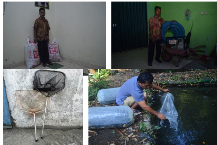
Gambar 4 Pemberian modal usaha kepada mitra 1

Permasalahan kedua yang terjadi adalah kurangnya biaya dalam pembelian bibit ikan bawal, pakan, dan peralatan operasional lainnya seperti mesin diesel, seser dan pipa buat pengairan. Sehingga dalam hal ini mitra diberikan modal berupa bibit ikan bawal dan pakan ikan untuk biaya produksi selama 6 bulan sampai masa panen, dalam program ini diharapkan setelah panen, mitra dapat secara mandiri memenuhi biaya produksi dengan keuntungan yang didapatnya. Serta pemberian mesin diesel, yang awalnya hanya menyewa sekarang miliki pribadi, hal ini juga diharapkan untuk membantu meningkatkan produksi ikan bawalnya.