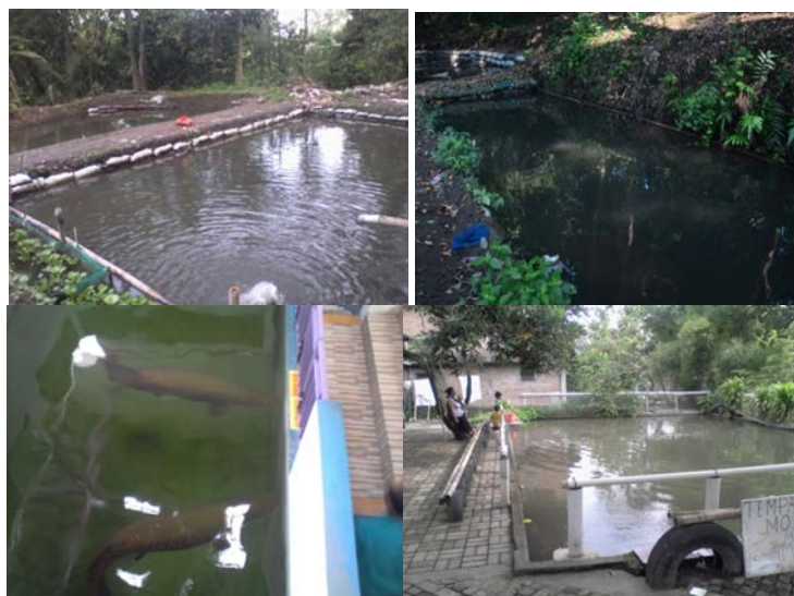
Gambar 2 Distribusi Frekuensi Beban dan Tahanan