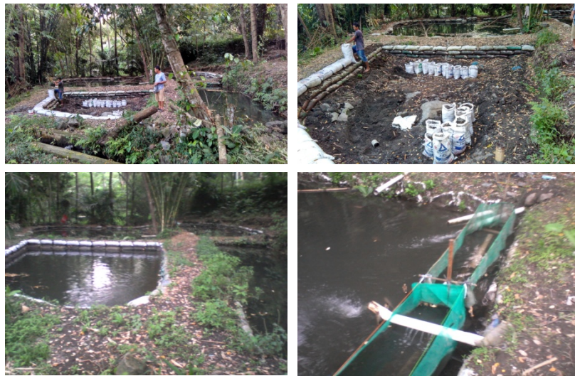
Gambar 3 Pembuatan kolam ikan