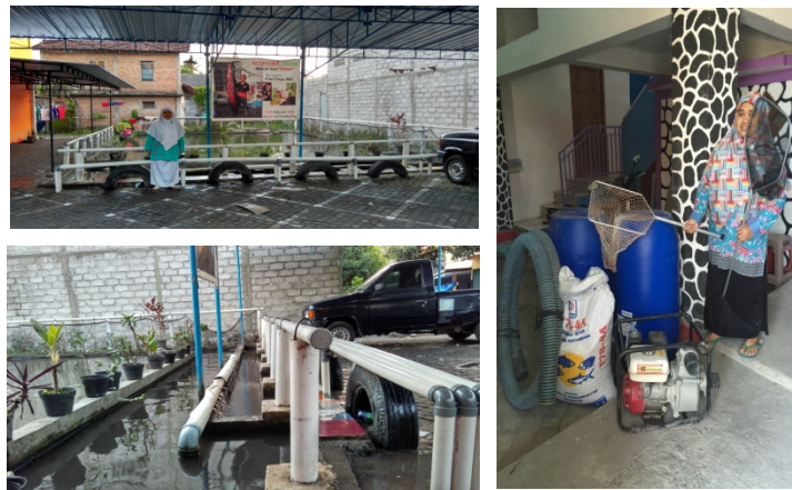
Gambar 5 Pemberian modal usaha kepada mitra 2