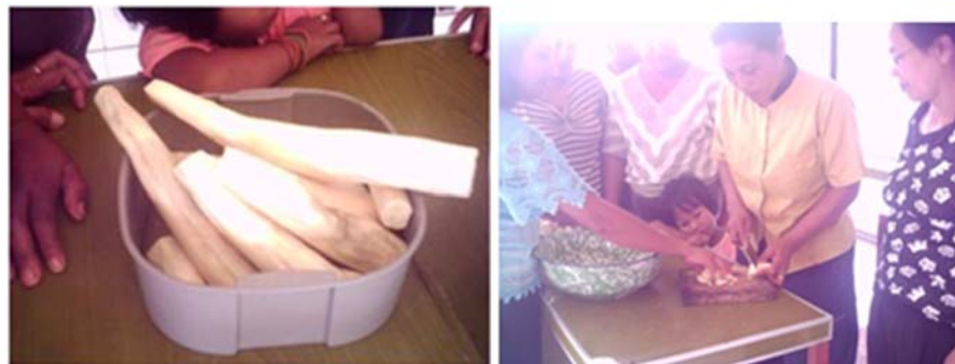
Gambar 3. Mengiris singkong secara konvensional