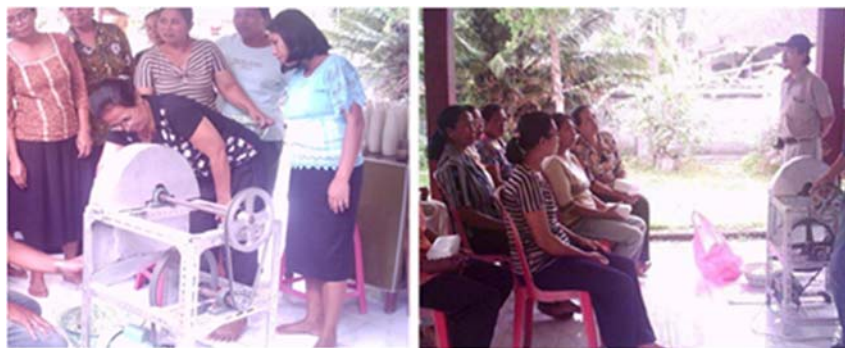
Gambar 4. Uji coba dan pengarahan cara pengoperasian mesin

Kegiatan tahapan berikutnya yaitu, peragaan dan uji coba alat di mitra 2 UD. Guruh Sari di desa Negari, kabupaten Klungkung. Selanjutnya pengenalan keselamatan kerja serta memberikan pengetahuan manajemen perusahaan, serta memberi gambaran dan dukungan untuk diversifikasi produk untuk kedua mitra.