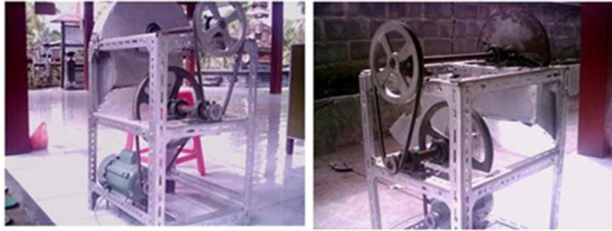
Gambar 2. Mesin pengiris/pemotong singkong