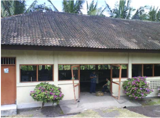
Gambar 2.1. Tempat Komposting

Metode yang dipergunakan dalam kegiatan pengabdian ini adalah peragaan alat pencacah sampah organik. Peragaan adalah memberikan kesempatan kepada warga masyarakat untuk mencoba alat secara langsung, dengan menghidupkan (on-off), dan mencoba memasukkan sampah oganik kedalam mesin dan langsung membuat kompos. Kegiatan peragaan telah dilaksanakan pada bulan Maret dan April diikutkan dalam kegiatan rutin di desa setempat, agar kesibukan warga masyarakat tidak terganggu.