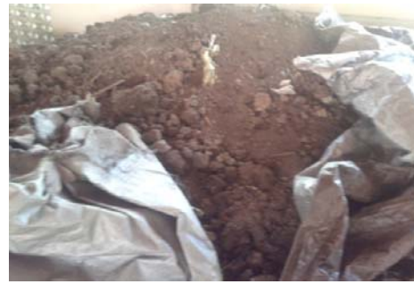
Gambar 3.6. Mesin Pencacah Sampah