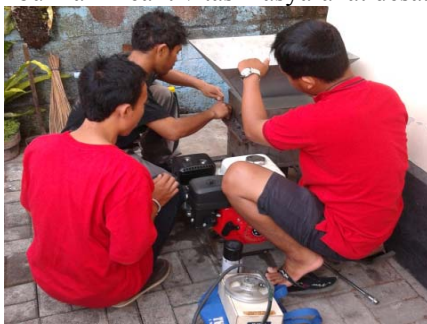
Gambar 3.1. Tempat Komposting

Manajemen produksi untuk menunjang keterampilan produksi yang dimiliki oleh pekerja TPA dianggap cukup menunjang terhadap proses pembuatan pupuk organik (kompos). Untuk mengembangkan ketrampilan pada pembuatan pupuk organik telah dilakukan penyuluhan atau diskusi tentang metode dan langkah-langkah produksi kompos di buat dari sisa pertanian dan rumah tangga. Selama ini telah dilakukan beberapa kegiatan seperti lomba tanaman hias untuk menumbuhkan kreativitas masyarakat desa.