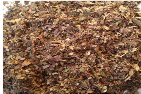
Gambar 3.4. Mesin Pencacah Sampah