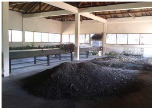
Gambar 3.7. Tempat Komposting