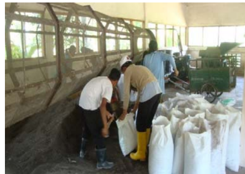
Gambar 3.8. Mesin Pencacah Sampah

Pada gambar-gambar di atas memperlihatkan beberapa kegiatan yaitu; perbaikan mesin pencacah oleh mahasiswa teknik mesin, tim peserta pelatihan foto bersama sebelum kegiatan, pemaparan tentang penting menjaga lingkungan, kebersihan dan cara pembuatan kompos, gambar selanjutnya adalah hasil cacahan sampah daun-daunan sampai menjadi kompos, dan gambar terakhir adalah proses pengepakan kompos.