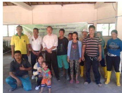
Gambar 3.2. Mesin Pencacah Sampah