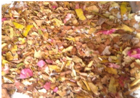
Gambar 3.5. Tempat Komposting