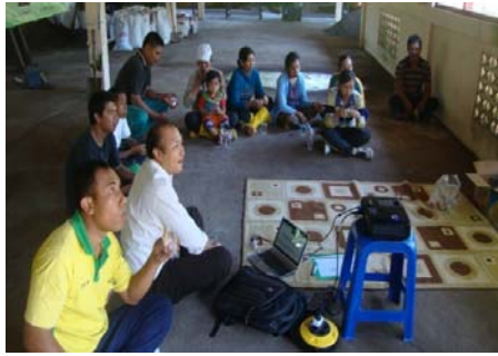
Gambar 3.3. Tempat Komposting