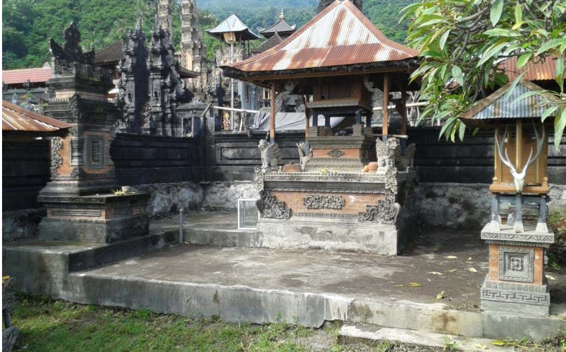
Gambar 3.1 Pura Beji Sebelum Pemugaran