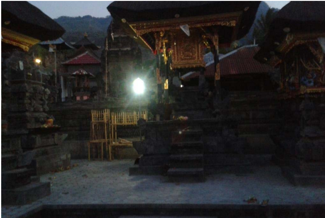
Gambar 3.2. Pura Beji Setelah Pemelaspasan dan Implementasi (Dari Dalam)