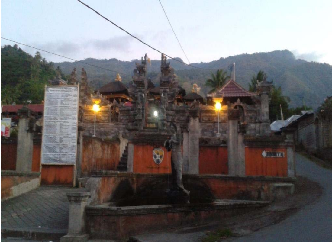
Gambar 3.3. Pura Beji Setelah Pemelaspasan dan Implementasi (Dari Luar)