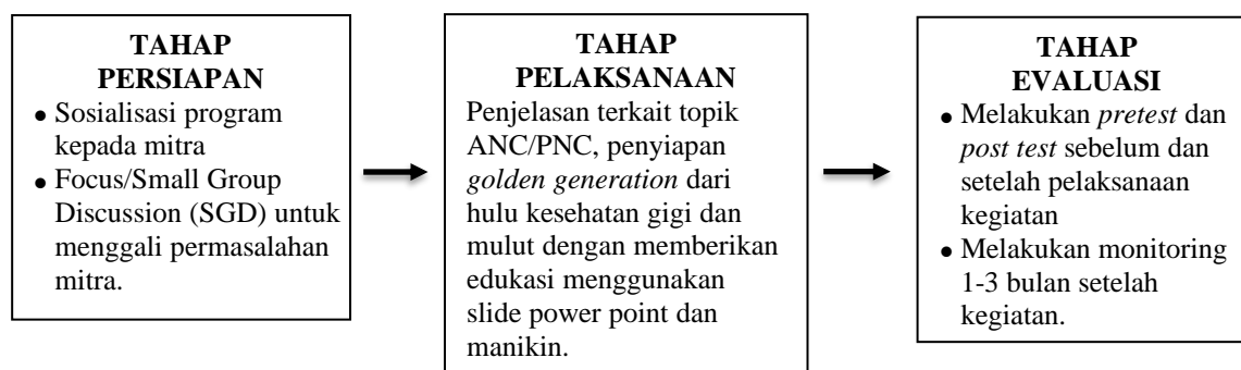
Gambar 2.1. Skema Alur Pemecahan Masalah

Alur pemecahan masalah sebagai berikut :