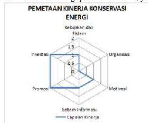
Gambar 4. Grafik Pemetaan Kinerja Konservasi Energi

Dalam penelitian ini acuan yang akan digunakan untuk menilai kinerja tentang konservasi energi digunakan matriks manajemen energi. Kategori yang ada dalam matriks ini mencakup kebijakan dan sistem, organisasi, motivasi, sistem informasi, promosi dan investasi. Tiap indikator dari kategori-kategori yang ada kemudian dinilai berdasarkan tingkatan mulai dari tingkat terendah bernilai 0 hingga tertinggi bernilai 4. Dalam hal penilaian, penggunaan matriks akan memudahkan pihak manajemen dalam memetakan kondisi eksis dari pengelolaan energi perusahaan maupun melakukan evaluasi terhadap kinerja yang telah dicapai dalam program konservasi. Berikut hasil pemetaan konservasi energi pada rumah sakit, yaitu: