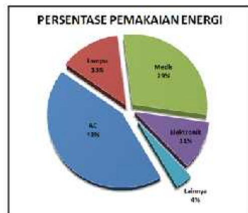
Gambar 3. Grafik Persentase Pemakaian Energi

Untuk mengetahui persentase pemakaian energi listrik dapat dilakukan melalui perhitungan besarnya daya peralatan, lamanya waktu pemakaian serta pengaruh faktor pengalinya dan hasil akhir perhitungan yang diperoleh kemudian diakumulasi berdasarkan pengelompokan berdasarkan jenis peralatan sehingga diperoleh komposisi penggunaan energi untuk tiap peralatan. Dari hasil perhitungan diperoleh hasil konsumsi energi listrik diperuntukan pengoperasian AC, peralatan medis, penerangan, elektronik dan peralatan lainnya. Berikut hasil pemetaan pendistribusian energi listrik: