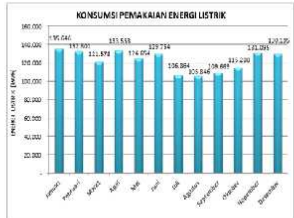
Gambar 2. Grafik Tingkat Konsumsi Energi Listrik

Untuk tingkat hunian kamar rawat inap, Rumah Sakit Umum Surya Husadha Denpasar memiliki tingkat hunian kamar pasien rata-rata 75% selama tahun 2011. Tingginya tingkat hunian kamar akan mempengaruhi tingkat konsumsi listrik. Berikut tingkat konsumsi pemakaian energi listrik tiap bulan: