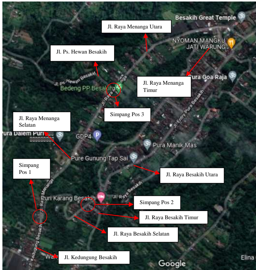
Gambar 2. Lokasi Simpang dan Ruas di Kawasan Pura Besakih

Simpang dan ruas di Kawasan Pura Besakih sesuai dengan kondisi saat ini. Adapun tahapan analisis kinerja Simpang dan ruas di Kawasan Pura Besakih dijelaskan sebagai berikut.