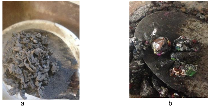
Gambar 3. (a) Penyelimutan Agregat Halus (b) Penyelimutan Agregat Kasar

Pada gradasi campuran HRS-WC, untuk penyelimutan agregat kasar 100% setelah diobservasi secara visual diperlukan sebanyak 30gram yaitu 8,6% cacahan plastik dari berat total agregat kasar. Untuk penyelimutan 50% dapat digunakan setengah bagian dari berat plastik pada penyelimutan 100% yaitu sebanyak 15 gram atau 4,2% dari berat total agregat kasar.