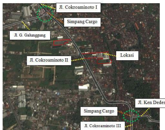
Gambar 1. Lingkup Penelitian

Gambar 1 memperlihatkan ruang lingkup penelitian ini meliputi 5 ruas jalan yaitu Jalan Cokroaminoto I, Jalan Cokroaminoto II, Jalan Cokroaminoto III, Jalan Gunung Galunggung, dan Jalan Ken Dedes, serta