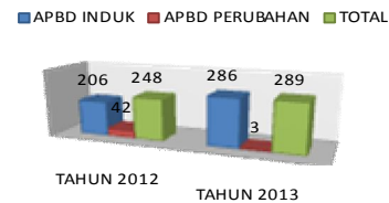
Gambar 2 Jumlah Kegiatan Proyek Konstruksi konstruksi Pemerintah Kabupaten Badung TA 2012 – TA 2013 diperoleh:

Hasil olah data yang diperoleh dari laporan belanja modal kegiatan proyek