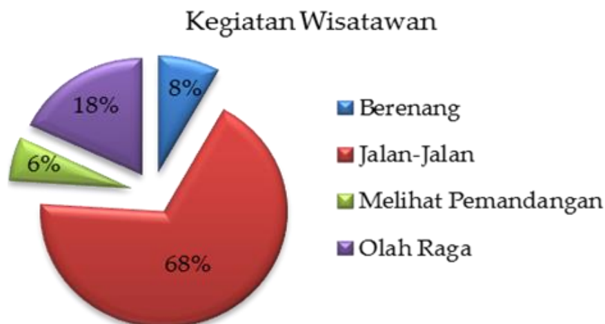
Gambar 2. Kegiatan wisatawan di Pantai Yeh Gangga

Berdasarkan hasil wawancara yang dilakukan dengan 100 responden di Pantai Yeh Gangga, sebagian besar terdiri dari wisatawan domestik sebesar 73% dan wisatawan mancanegara sebesar 27%. Kegiatan wisata jalan-jalan merupakan aktivitas yang dilakukan oleh 68% wisatawan, kegiatan wisata olahraga dilakukan sebanyak 18% wisatawan, sedangkan 8% dari wisatawan melakukan kegiatan berenang, dan kegiatan wisata melihat pemandangan dilakukan oleh 6% wisatawan yang berkunjung ke kawasan wisata Pantai Yeh Gangga (Gambar 2).