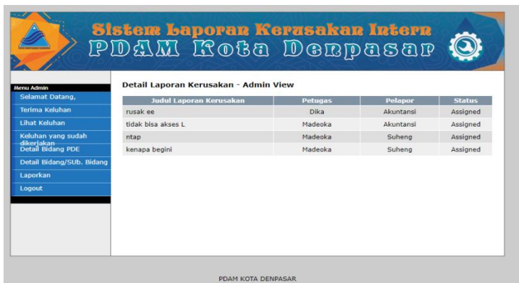
6 User Interface Menu Lihat Detail Keluhan

Terdapat juga menu Lihat Detail Keluhan, dimana menu ini berisi status keluhan yang sedang diproses oleh ePegawai PDE. Tampilannya seperti pada gambar 4.6 di bawah ini :