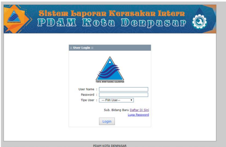
Gambar 3 User Interface Login