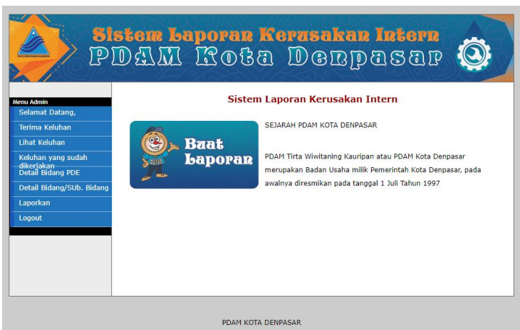
Gambar 4 User Interface Halaman Utama Admin

Pada User Interface Halaman Utama untuk pelanggan, terdapat sejarah dari PDAM Kota Denpasar serta beberapa menu yaitu terima keluhan, lihat keluhan, lihat keluhan selesai, detail pegawai PDE, detail Pegawai Bidang/Sub Bidang, dan laporkan.