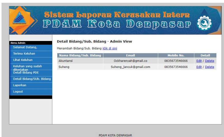
Gambar 9 Menu Detail Bidang Sub. Bidang

pada menu Detail Bidang/Sub. Bidang admin bisa menambah pelanggan mengedit dan menghapus pegawai.