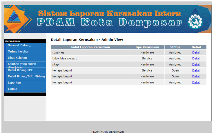
Gambar 5 User Interface Menu Terima Keluhan