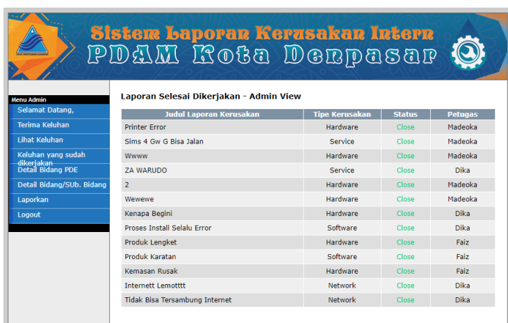
Gambar 7 Menu Lihat Keluhan Selesai.

Pada Menu Lihat Keluhan Selesai status pada bagian keluhan akan berubah menjadi close dan keluhan tidak terlihat di menu pegawai Bidang/Sub. Bidang atau pegawai PDE.