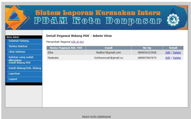
Gambar 8 Menu Detail Pegawai PDE

Pada menu Detail Pegawai admin bisa menambah pegawai Bidang PDE dan juga bisa mengedit atau mendelete pegawai.