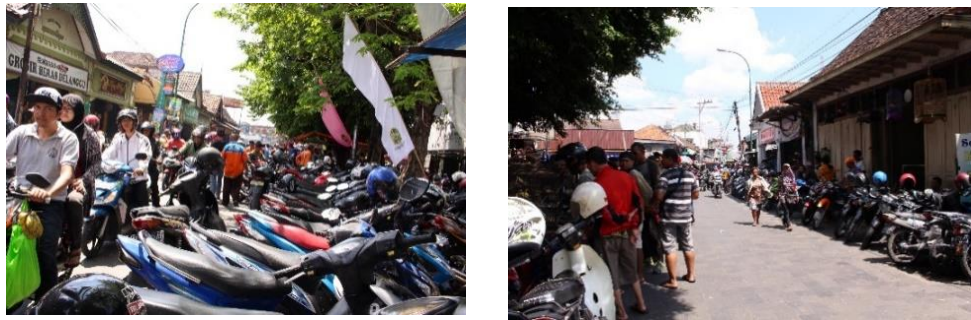
Gambar 2. Kondisi Lahan Parkir Kotagede