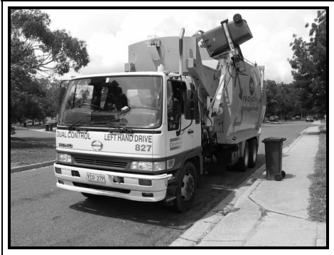
Gambar 3 Compactor Truck

Dalam penelitian ini sampah diangkut dengan menggunakan compactor truck dan arm roll truck . Pola pengangkutan yang digunakan untuk kendaraan compactor truck adalah pola pengangkutan dengan sistem kontainer tetap.