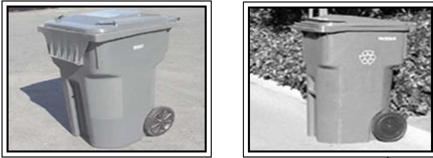
Gambar 1. Bin Kontainer Kapasitas 0,36 m 3