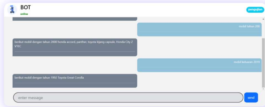
Gambar 3 Halaman pencarian data