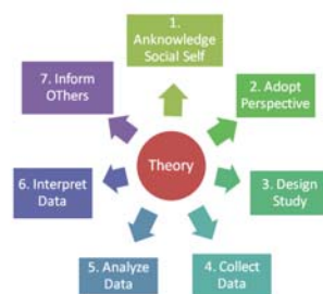
Gambar 1: Steps in the Qualitative Research Process

Menurut Norman Denzin dan Yvonna Lincoln (2003) dalam Neuman (2006), tahap-tahap dalam penelitian kualitatif dimulai dengan self-assesment dan refleksi mengenai situasi dalam konteks sosio historical . Penelitian kualitatif tidak hanya berfokus pada pertanyaan spesifik tetapi juga mempertimbangkan paradigma theory-philosophy , juga mengadopsi perspektif, melakukan desain studi mengumpulkan data, analisis data dan menginterpretasikannya. Tahap-tahap dalam proses penelitian kualitatif digambarkan sebagai berikut: