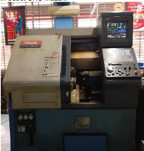
Gambar.1 Mesin Bubut CNC

Proses pemesinan dilakukan dengan menggunakan mesin bubut CNC Mazak.