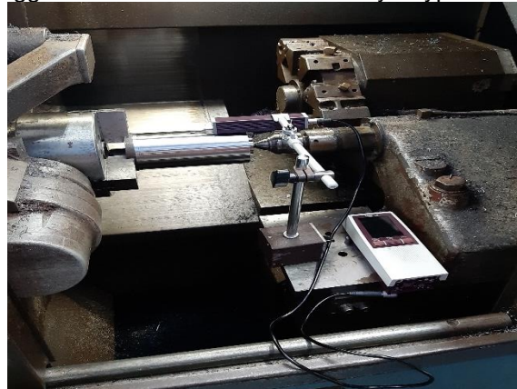
Gambar 4. Surface Test

Parameter pemotongan yang digunakan antara lain : Kecepatan pemotongan ( V_c ) = 348 m/min, hantaran pemotongan ( f ) = 0.2 mm/rev, kedalaman pemotongan ( a ) = 0.05, 0.10, 0.2, 0.4, 0.6, 0.8 mm. Pengukuran kekasaran permukaan benda kerja menggunakan alat surfacet test Mitutoyo Type SJ 210