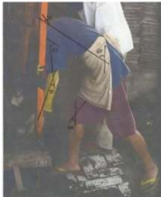
Gambar 6. Gerakan Gerakan Mengambil Batako Basah dari Mesin Cetak