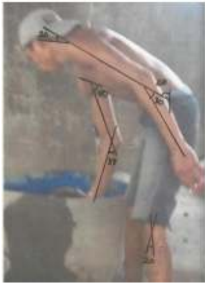
Gambar 3. Gerakan Mengambil Air