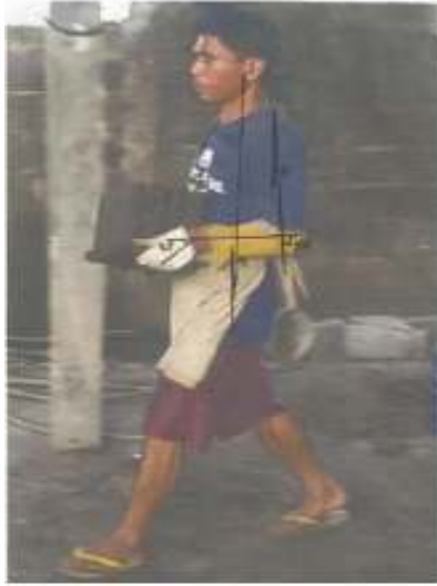
Gambar 7. Membawa Batako Basah di Tempat Pengeringan