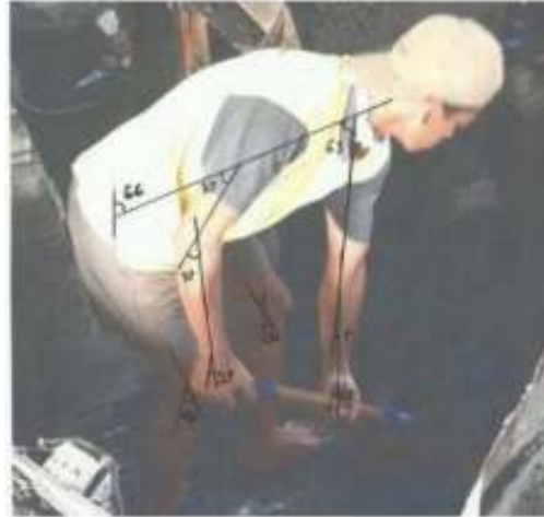
Gambar 4. Gerakan Menyekop Campuran Bahan Baku