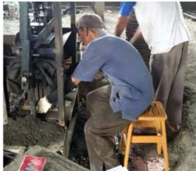
Gambar 9. Prosen Mengambil Batako Setelah Perbaikan

batako basah dari mesin cetak, punggung pekerja saat membungkuk berubah menjadi 40^\circ , mengalami penurunan 20^\circ dibandingkan sebelum perbaikan, dan tubuh bagian bawah yaitu kaki, menjadi lebih stabil, sehingga pengangkatan batako basah tidak memberatkan pekerja. Analisis REBA setelah dilakukan perbaikan menunjukkan nilai akhir REBA sebesar 6, maka tingkat risiko pekerja sedang dan perlu dilakukan perbaikan. Nilai REBA setelah perbaikan sebesar 6 menunjukkan penurunan dibandingkan nilai REBA sebelum perbaikan dengan skor 11. Hal ini karena bagian kaki yang lebih stabil dan leher dalam posisi lurus dibandingkan postur kerja sebelum perbaikan. Gambar postur kerja setelah perbaikan dapat dilihat pada Gambar 9 berikut dan tabel analisis REBA setelah perbaikan dapat dilihat pada Tabel 10.