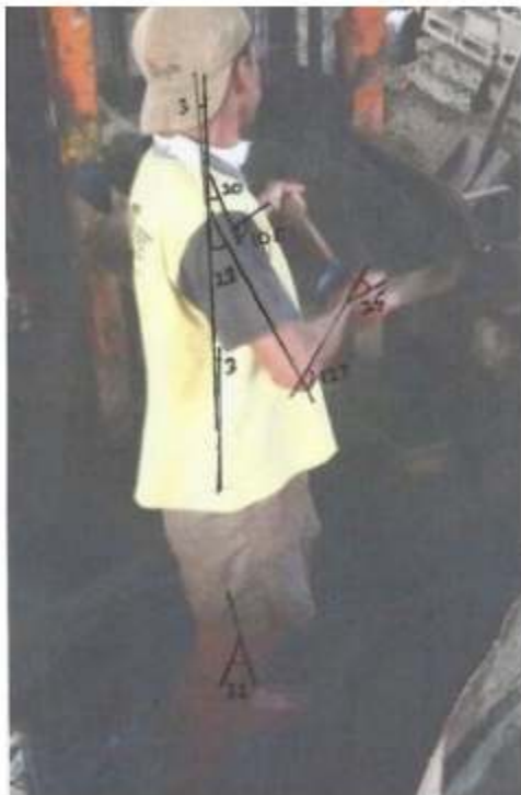
Gambar 5. Gerakan Mendorong Campuran Bahan Baku ke Dalam Mesin Cetak