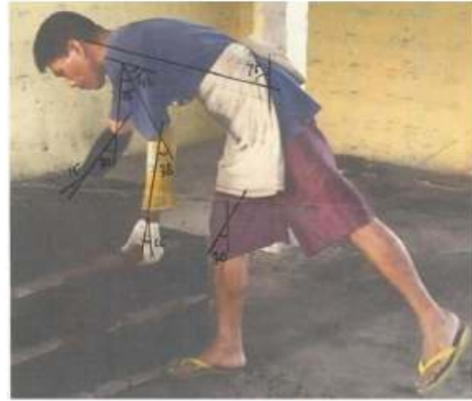
Gambar 8. Meletakkan Batako Basah di Tempat Pengeringan