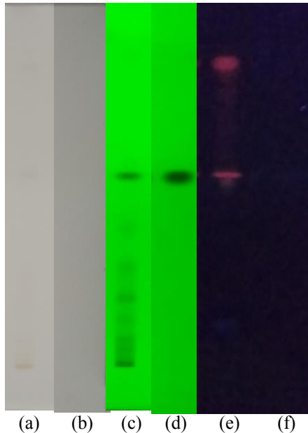
Gambar 2. Pola kromatografi serbuk simplisia teh hitam. a) serbuk teh hitam pada sinar tampak; b) katekin pada sinar tampak; c) serbuk teh hitam pada sinar UV 254 ; d) katekin pada sinar UV 254 ; e) serbuk teh hitam pada sinar UV 366 ; f) katekin pada sinar UV 366 .

Senyawa katekin pada sinar UV 254 tampak dengan jelas dan letak senyawa katekin pada penelitian ini telah sesuai dengan pola kromatografi pada FHI yaitu pada Rf 0,5.