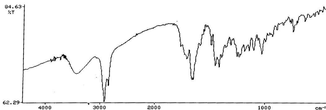
Gambar 1. Spektrum inframerah dari isolat aktif antimakan

gelombang 1495,9 cm -1 dan 1457,3cm -1 yang diduga menunjukkan adanya gugus C-H bending alifatik. Serapan tajam dengan intensitas kuat pada daerah bilangan gelombang 1717,7 cm -1 menunjukkan adanya gugus C=O stretching . Adanya serapan pada daerah bilangan gelombang 1654,4 cm -1 diduga dari gugus C=C stretching alifatik. Hasil spektrum inframerah dari isolat aktif antimakan ditunjukkan pada Gambar 1 (Harborne, 1987; Sastrohamidjojo, 1985).