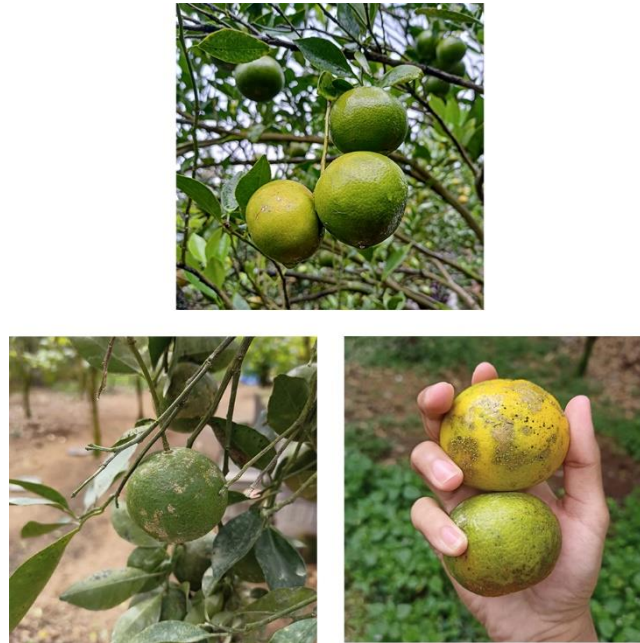
Gambar 1. Buah jeruk siam kintamani yang sehat dan terserang penyakit kudis

Di lokasi pertanaman yang sama, penyebaran penyakit kudis ini sangatlah cepat, pada areal yang sudah terserang kudis sangat sulit menemukan buah jeruk dengan kulit bersih dan mulus. Penyebab cepatnya perkembangan penyakit diakibatkan oleh kondisi lingkungan sekitar pertanaman mendukung perkembangan dan penyebaran patogen penyebab penyakit kudis. Kecamatan Payangan memiliki suhu udara cukup rendah berkisar 21-30°C, memiliki curah hujan tinggi dengan rata-rata 1.276 mm/tahun. Dengan kondisi iklim tersebut dan jarak tanam pohon jeruk di lokasi pengamatan yang cukup rapat (kelembaban semakin tinggi), daerah Payangan sangat mendukung perkembangan patogen kudis jeruk.