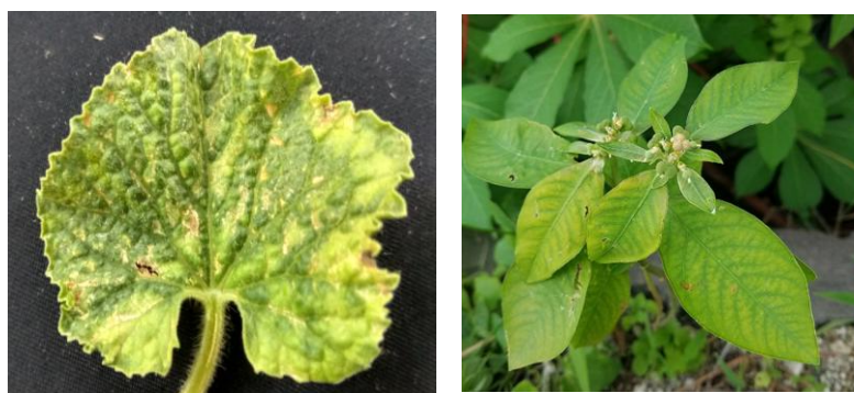
Gambar 1. Gejala mosaik vein banding dan klorosis yang di temukan di lapang (A) Tanaman Melon; (B) Gulma Euphorbia heterophylla

Sampel gulma diperoleh di lahan pertanian yang membudidayakan tanaman melon di Denpasar. Pengambilan sampel dilakukan dengan mengambil gulma yang bergejala mosaik seperti pada Gambar 1.