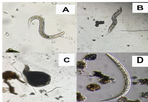
Gambar 4. Perbedaan morfologi nematoda jantan dan nematoda betina ( Meloidogyne spp.) (A) Nematoda jantan menjelang stadia 3 pada akar (B) Nematoda betina

Setelah nematoda stadia 2 berhasil melakukan penetrasi pada sistem perakaran ditemukan nematoda jantan stadia 2 menjelang stadia 3 diperakaran, kemudian diperakaran terdapat juga nematoda betina menjelang stadia 3 diperakaran. dan stadia dewasa yang membentuk masa telur dalam akar. Setelah bisa masuk ke dalam akar larva bergerak diantara sel-sel. Luc et al. , (1995) menyatakan larva dapat tinggal di dalam puru atau berpindah secara interseluler melalui jaringan parenkim korteks menuju tempat makanan baru di dalam jaringan akar yang sama. Stadia nematoda yang paling banyak ditemukan adalah stadia 2 dan 3 pada kedua jenis sampel. Hal ini didukung oleh Hussey dan Barker (1973) larva instar II ini merupakan stadia yang sangat aktif dan infeksiif, pada Gambar (4).