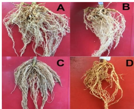
Gambar 1. Penampakan akar tanaman yang terserang nematoda ( Meloidogyne spp.) (A) Perakaran tanaman tomat, (B) Perakaran tanaman terong, (C)

Hasil rata-rata pada beberapa parameter menunjukkan bahwa terdapat perbedaan nyata antara masing-masing tanaman familia Solanaceae yang diujikan. Hal ini terjadi dikarenakan pada masing-masing tanaman memiliki tingkat kemampuan yang berbeda-beda dalam menekan tingkat penetrasi dan tingkat fekunditas nematoda ( Meloidogyne spp.).