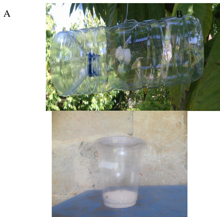
Gambar 1. A) Perangkap Beratraktan, B) Gelas Plastik

Metode nisbi yaitu metode untuk melihat populasi jenis lalat buah dengan menggunakan perangkap yang beratraktan. Perangkap dibuat dengan memotong 3 cm bagian ujung depan botol plastik yang berukuran panjang 32 cm dan diameter 8 cm. Bagian tersebut dipasang kembali secara terbalik seperti corong. Perangkap tersebut merupakan modifikasi perangkap steiner (Kardinan 2007). Pada bagian atas botol plastik diberi alat pengait dari kawat untuk menggantungkannya pada cabang pohon. Pada bagian dalam dipasang alat pengait sebagai tempat untuk menggantungkan bulatan kapas yang telah diberi atraktan (Gambar 1A). Atraktan yang digunakan adalah Metyl eugenol (ME), Cue lure (CU), dan Dorsal lure (DL). Atraktan diteteskan sebanyak 2cc pada kapas yang diletakan pada bagian dalam botol perangkap.