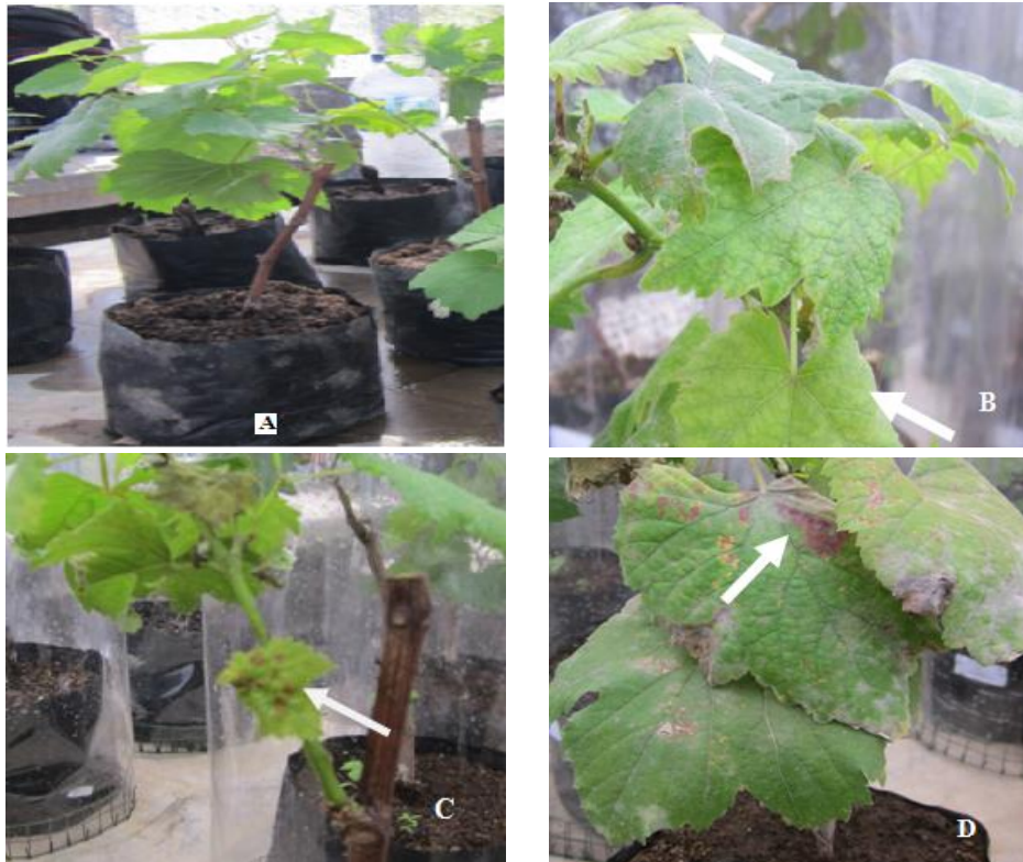
Gambar 5. Variasi gejala pada tanaman anggur akibat infeksi GLRaV-3, A. Tanaman anggur sehat, B. Hanya klorotik pada daun, C. Daun menjadi berwarna merah, D. Daun berwarna merah, klorotik dan menggulung.

Gejala daun menjadi klorotik, berwarna merah dan menggulung ditemukan pada tanaman anggur varietas Red Prince dan Black Caroline (Gambar 5). Sedangkan gejala klorotik saja tanpa menunjukkan warna merah dan menggulung ditemukan pada tanaman anggur varietas Green Belgy, Ceplukan, dan Bunga Sepatu. Penelitian Fuchs et al. , 2009 yang menggunakan satu kultivar anggur hibrida dari 12 kultivar anggur, hanya menemukan enam kultivar yang memberikan reaksi negatif terhadap GLRaV-3, yaitu kultivar Lemberger, Cabernet Franc, Chardonnay, Gewurtztraminer, Pinot Noir, dan Riesling.