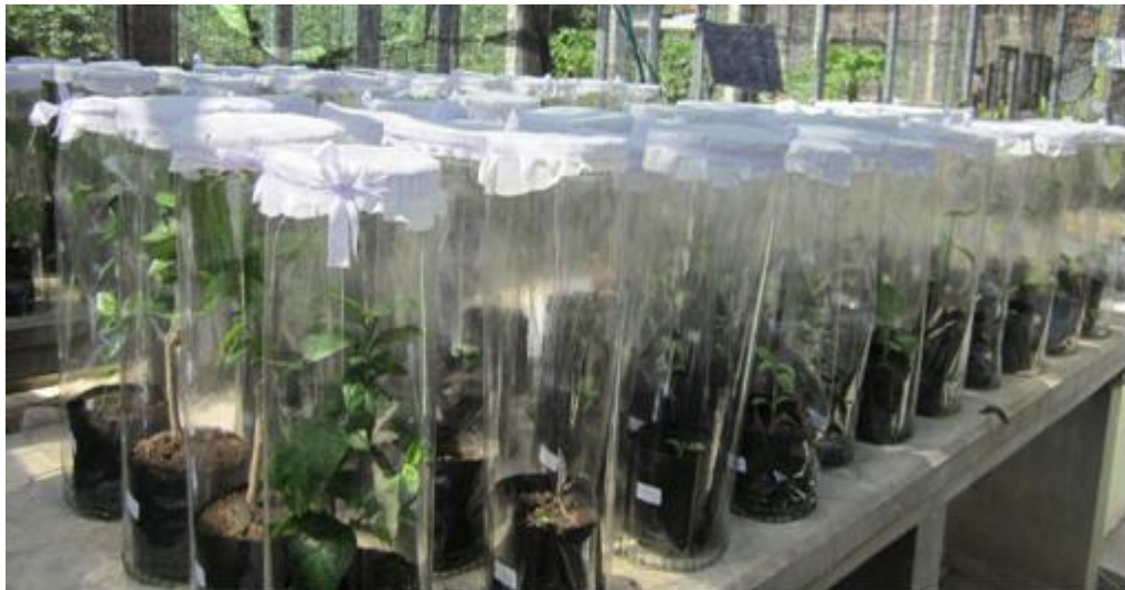
Gambar 4. Delapan belas spesies tanaman indikator untuk uji kisaran inang GLRaV-3

Inokulasi GLRaV-3 melalui mealybug dapat menimbulkan gejala pada 3 spesies tanaman uji. GLRaV-3 isolat Kubutambahan menginfeksi tanaman anggur ( Vitis vinifera ), Ceplukan ( Physalis floridana ) dan bunga sepatu ( Hibiscus rosa-sinensis ) dari 18 spesies tanaman yang digunakan dalam uji kisaran inang. GLRaV-3 hanya menginfeksi tanaman dari famili Vitaceae, Ceplukan dan Bunga Sepatu, tetapi tidak menginfeksi spesies-spesies dari famili, Leguminosae, Cucurbitaceae, Cruciferaeae, Amaranthaceae, dan Annonaceae (Gambar 5, Tabel 2).