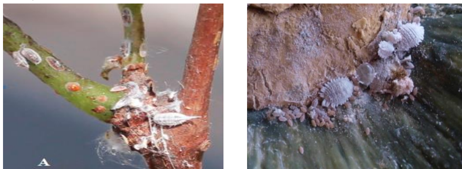
Gambar 1. Dua spesies mealybug yang mengkoloni pertanaman anggur di Kabupaten Buleleng (A) Ferrisia virgata (Ckll). dan (B) Maconellicoccus hirsutus

Hasil identifikasi menggunakan kunci determinasi William (2004), menunjukkan bahwa spesimen mealybug teridentifikasi menjadi 2 spesies yaitu Ferrisia virgata (Ckll.) (Hemiptera : Pseudococcidae) (K1, G2, S2) dan Maconellicoccus hirsutus (Green) (Hemiptera : Pseudococcidae) (K2, G1, S1, B) (Gambar 1).