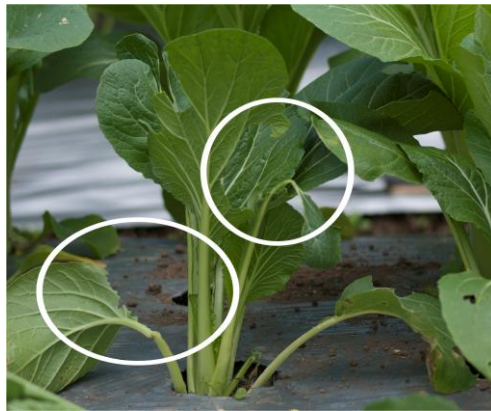
Gambar 3. Kerusakan yang diakibatkan oleh hama belalang

Berdasarkan Tabel 4 dapat diketahui bahwa campuran biourin dengan agen pengendali hayati pada tanaman sawi hijau di hari ke-21 berpengaruh nyata terhadap variabel kerusakan daun dan intensitas kerusakan daun. Jumlah daun rusak dan intensitas kerusakan daun terendah akibat hama belalang pada tanaman sawi hijau ditunjukkan oleh perlakuan biourin ditambah dengan B. thuringiensis dengan nilai 1 helai daun rusak dan nilai intensitas kerusakan daun 27,23%. B. thuringiensis dapat mengendalikan hama yang merusak tanaman dengan cara merusak sistem pencernaan. Kristal protein ( \delta -endotoksin) jika larut dalam usus serangga yang mengalami aktifitas proteolisis. Bt-protoksin akan menjadi polipeptida yang lebih pendek dan bersifat racun. Racun akan menyebabkan terbentuknya pori-pori pada sel membran pencernaan serangga sehingga mengganggu keseimbangan osmotik sel, sehingga sel akan membengkak dan pecah, akhirnya menimbulkan kematian (Bahagiawati, 2002).