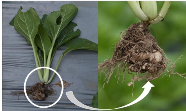
Gambar 5. Penyakit akar gada yang menyerang tanaman sawi hijau

karena memiliki nilai yang sama dengan perlakuan biourin tanpa tambahan agen pengendali hayati dalam mengendalikan persentase penyakit akar gada pada tanaman sawi hijau. Pemberian pupuk yang seimbang dapat meningkatkan ketahanan tanaman terhadap serangan penyakit dengan cara meningkatkan kualitas tanaman. Penelitian yang dilakukan Morgan dkk. (2005) menjelaskan pemberian bahan organik akan memperbaiki rhizosfer yang dapat membantu meningkatkan resistensi tanaman terhadap penyakit dan membantu toleransi tanaman terhadap senyawa toksik.